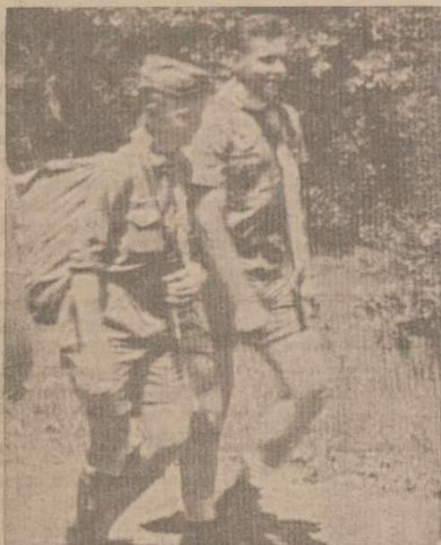
GAMTA PASIPUOŠE ŽALUMYNAIS IR ZIEDAIS Ir prasidėjo pavasario iškylių dienos.