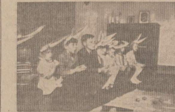
IŠ MARGUČIŲ RIDINEJIMO VARŽYBŲ BOSTONE