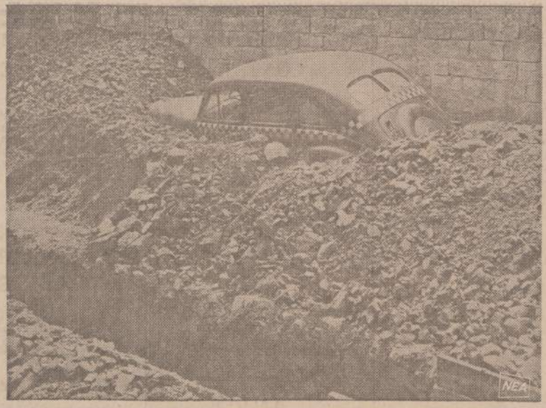
Darbininkai Istambule, Turkijoje įspėjo taxi vairuotoją, kad jis savo mašinos nepaliktu, kur jiems reikia dirbti, bet jis nepaklausė. Sugrįžęs atgal, jis rado savo automobilį, kaip parodyta paveiksle. Šoferis padavė darbininkus į teismą.