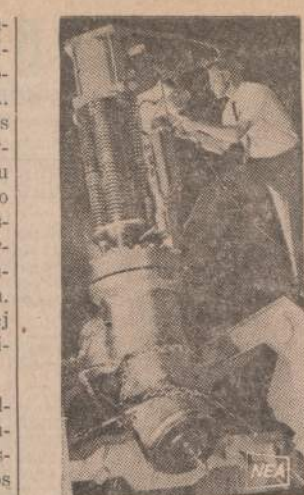
Atomine energija varomas elektros įėgainės turi turėti specialius įrengimus. Čia matomas garo izoliacijos vozivas. Atominės įėgainės greit pagamins Amerikioje 72 milijonus kilovatų elektros.

1949 m. atvykęs su šeima į JAV, imasi vadovauti N. Y. lietuvių Tremtinių draugijai; išrenkamas Am. Lietuvių Inžinierių ir Architektų S-gos pirmininku; ilgametis I-sios Sandaros kuopos pirmininkas, o taip pat ir daug metų ėjęs LVL S-gos, N. Y. kuopos pirmininko parei-