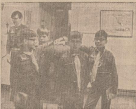
MALONŲ SUSITIKIMAS PRIE KIEKVIENOS LIETUVISKOS SENIENOS (Iš V. Krėvės ir Perkūno d-vių iškylos į St. Balzako Kultūros Muziejų).