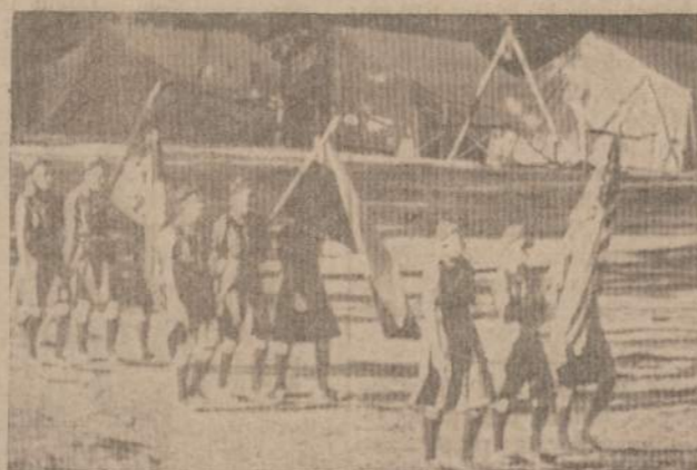
MIELI PERNYKŠČIAI PRISIMINIMAI vėl žaukia visus į stovyklą.

Po laužo visi skautai išsiskirstė truputuką nusivylę, bet geresni lietuviai.