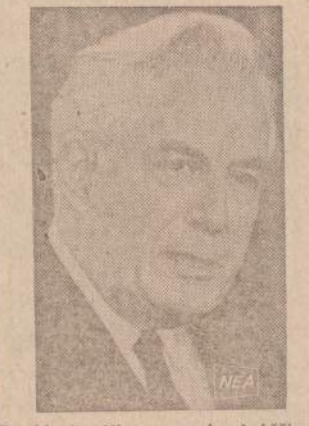
Prezidentas Nixonas nauju Aukščiausiojo Teismo teisėju paskyrė Warren Earl Burger. Kai senatas jį patvirtins, jis bus jau 14-tas Amerikos Vyriausybės Teisėjas. Prezidentu, kaip žinoma, Amerika jau turėjo 36.

Amerikos vyriausybė neprieštarauja šiam pasiūlymui, sutikdama, kad išsamioms deryboms ir ilgalaikėi sutarčiai reikia daugiau laiko. Amerika turi Ispanijoje svarbų Rota uostą, kur laikomi atomine energija varomi povandeniniai laivai ir tris aerodromus savo strateginės komandos lėktuvams. Amerikos bazės Ispanijoje vertinamos 500 milijonų dolerių.