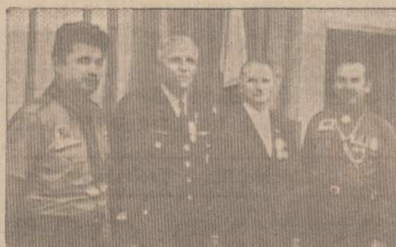
ŠALIŲ SAJUNGOS VADOVAI TARP MŪSISKIŲ

Chicago Skautų ir Skautėjų Tuntų Vadijos