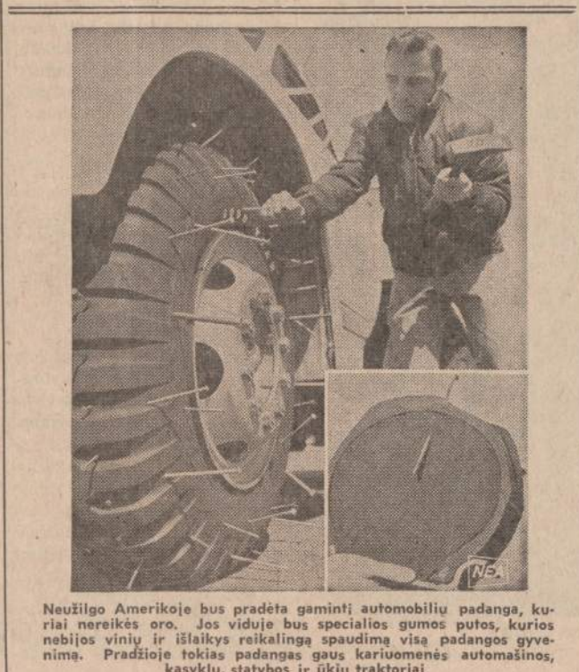
Neužilgo Amerikoje bus pradėta gaminti automobilių padangas, kurias nerūšiš oro. Jos viduje bus specialios gumos putos, kurios nebijos vinių ir išlaikys reikalingą spaudimą visą padangos gyvenimą. Pradžioje tokias padangas gaus kariuomenės automašinos, kasyklų, statybos ir ūkių traktoriai.

— Lietuvių ar jų drauge su latviais ir estais suruoštuose Birželio įvykių minėjimuose priimtuoju nutarimus prašoma siųsti kraštų vyriausybėms, parlamentams ir dėti pastangų, kad būtų įdėti vietinėje spaudoje. (E)