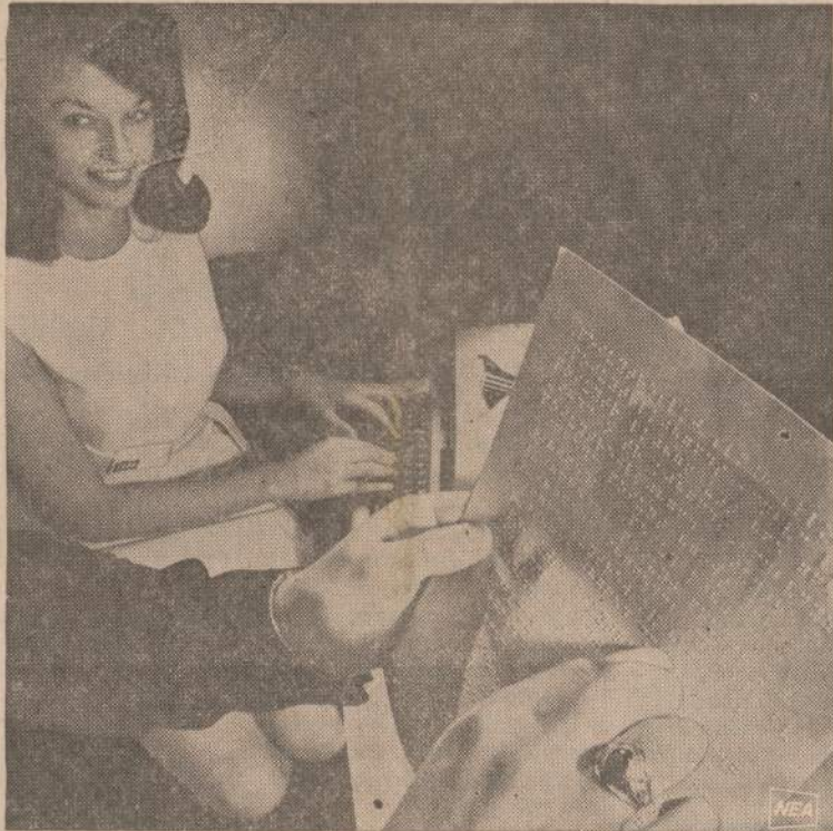
IBM korporacija pagaliau išrado rašomą mašinėlę, kurią galės naudoti ir aklieji. Ji rašo braille sistema, kurią naudoja 45,000 Amerikos aklyjų.

Kriminalinės policijos žiniomis, nepilnamečiai Chicagoje padarė 34 nuosimčius aplėšimui, 52 nuosimčius įsilaužimui ir 61 nuos. automobilių vagysčių.