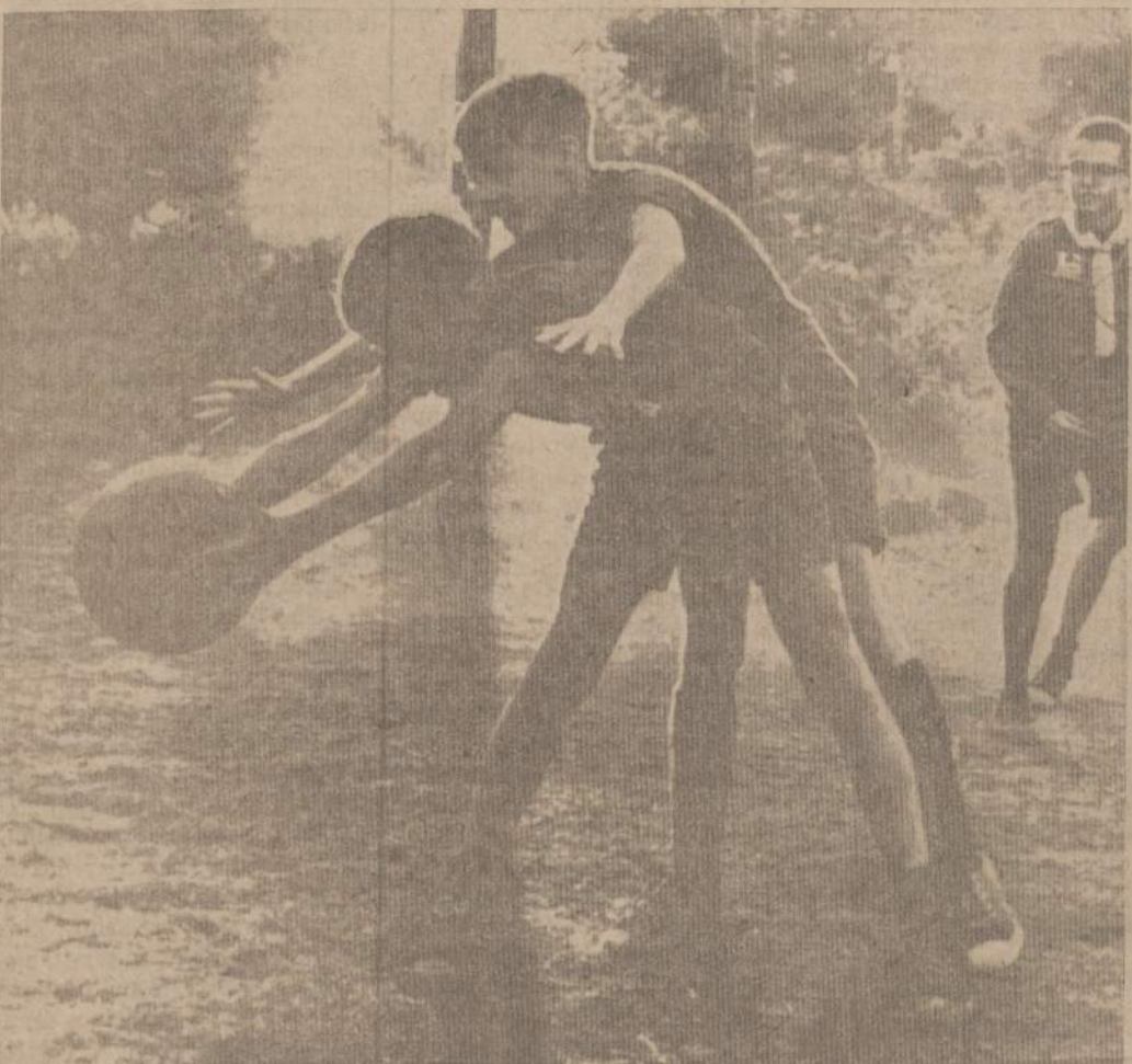
MOMENTAS IS KAMUOLINIO ŽAIDIMO VARŽYBŲ STOVYKLOJE pačių įrengtoje krepšinio aikštėje.