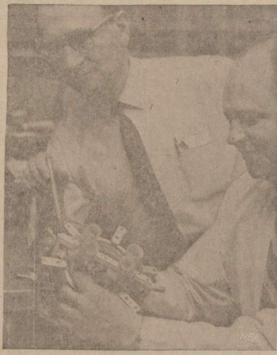
Du Clevelando inžinieriai Fordo motoru fabrike Jerabek ir Verbiški laisvu laiku pagamino naujos rūšies dirbtinę širdį, kuri sveria tris svarus ir susideda iš nerūdijančio plieno, alumino ir gumos dalių. Medicinos ekspertai jau susidomėjo šių inžinierių kūriniais.

1739 So. Halsted St., Chicago, Ill. 60608