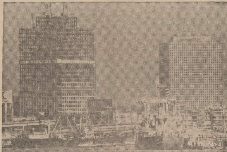
Japonijoje žemės drebėjimai — dažnas svečias, todėl japonai visada statydavo neaukštus, lengvus namus. Patobulėjus statybos technologijai ir japonai ėmė statyti dangoraižius, kurie paveikėle matomi prie Tokijo uosto. Kairėje matomas pastatas bus 40 aukštų, aukščiausias visame mieste.

Dėl šito plano buvo nemažai priekaištų miesto vadams. Vaikų Knygų organizacija rašė protestus, sakydama, kad bibliotekų sumažinimas gali atsiliepti į vaikų auklėjimą ir švietimą. Pagaliau meras Lindsay pranešė, kad buvo rasti pajamų šaltiniai, kurie išgelbės bibliotekas nuo uždarymo.