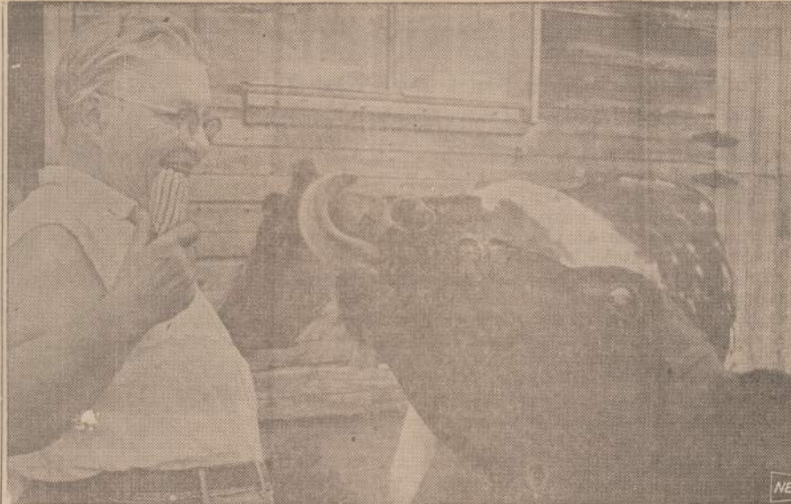
Nors pavasaris jau užaugino ganyklų žolės ir pašaro netrūksta, amerikietiškos karvės geriau mėgsta kukurūzus, kaip matosi iš šios nuotraukos, darytos Wisconsinso ūkyje.

Ne be reikalo Džilas (Džilas), buvęs Jugoslavijos viceprezidentas, savo paskutinėje knygoje pranašauja, jog po kelių dešimt metų dabar skelbiamas komunizmas tiek pasikeis, jog mažai ką bendro turės su tuo, kas dabar praktikuojama komunistiniuose kraštuose.