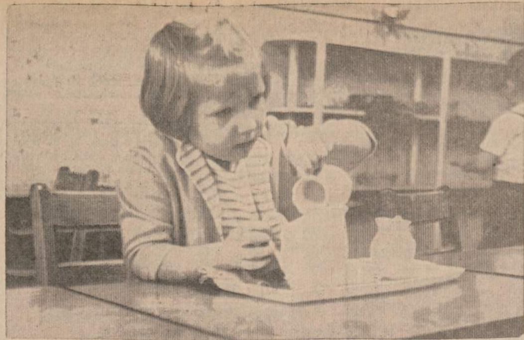
Amerikos Lietuvių Montessori Vaikų Nameliuose, 2743 W. 69th Street, auklėtinė dirbdama su vandens šocias netiesioginiai mokina rankuotes atliecis rašymo darbams.