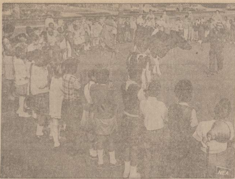
Daug Amerikos miestų vaikų nėra matę karvės. Viena Clevelando mokykla specialiai paprašė ūkininkų, kad jie atgabentų į mokyklos kiemą savo galvijų. Ūkininkai parodė mokiniams karvę, parodė veršuką ir pamokino, kaip karvės melžiamos.

Visi esame girėdę apie baisias blogos mitybos pasekas. Yra negerovių atsirandančių ir dėl dvasinio maisto stokos. Štai, pvz., vaikas atvežtas ligoninėn vemiąs, svorio nustojęs ir nusilpęs. Jis pradėjo vemi šėšiu savaičių amžiaus. Dabar jis jau šėšių mėnesių — ligoninėj at-