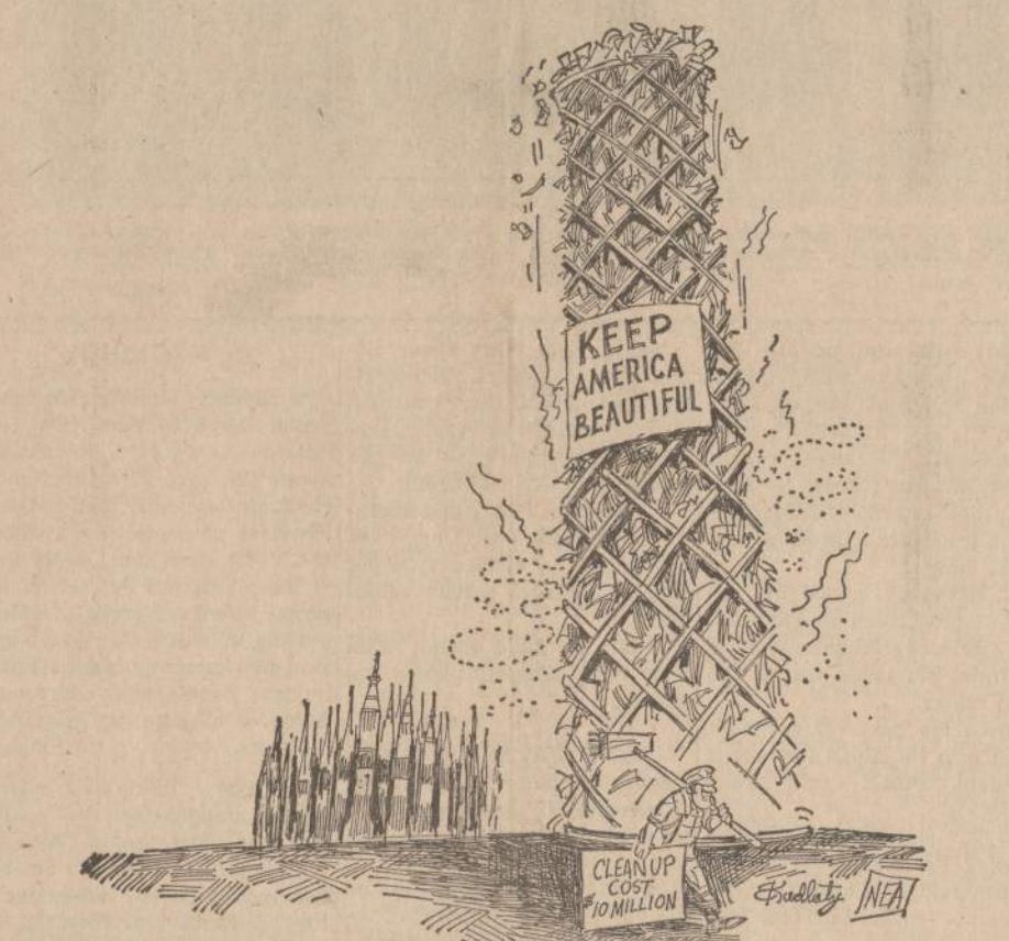
Amerikos Saturno raketa yra 363 pėdos aukščio ir sveria 6 milijonus svarų. "Keep America Beautiful" organizacija apskaičiavo, kad amerikiečiai primtė per Memorial Day savaitgalį tiek įvairių šiukšlių, kad reiktų 47 Saturno raketų joms išvežti. Tų šiukšlių surinkimas Amerikai kainuoja 10 mil. dolerių.

Dar nežinia, ką prezidentas Nixonas paskirs į pasitraukusio teisėjo Abe Fortas vietą. Prezidentas pareiškė, paskelbsiąs kandidatą, kai senatas patvirtins pirmininką.