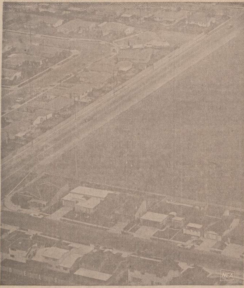
Los Angeles miesto pakraščių vaizdas. Žemę naudoja ne tik apylinkės ūkininkai, bet ir kiekvienas sklypo savininkas savo kieme pasisodina daržovėmis. Apylinkės klimatas geras daržovėms.