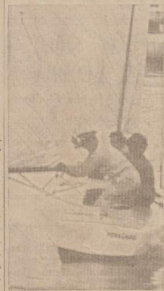
JACHTA "PERKŪNAS" pamažu tolsta nuo krantinės