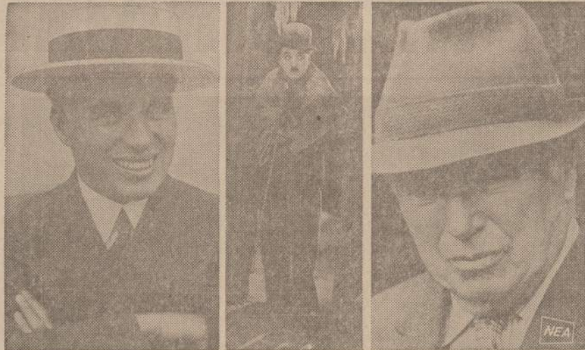
Garsus filmų aktorius Carlis Caplinas neseniai šventė 80 metų sukaktį (dešinė). Jis netrukus rengiasi statyti naują filmą. Kairėje jis matomas prieš 40 metų darytoje nuotraukoje, o vidury — jo filmų mėgiamas charakteris.

Panašų pasiūlymą Powell jau daręs 1968 metų balandžio mėnesį, perspėdamas, kad priešingai prasidės rasišnis smurtas.