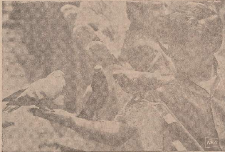
New Yorko parke karveliai taip pripratę prie žmonių, kad nebijo ir ant rankų atsistūpti, ypač jei jose yra maisto trupinių.