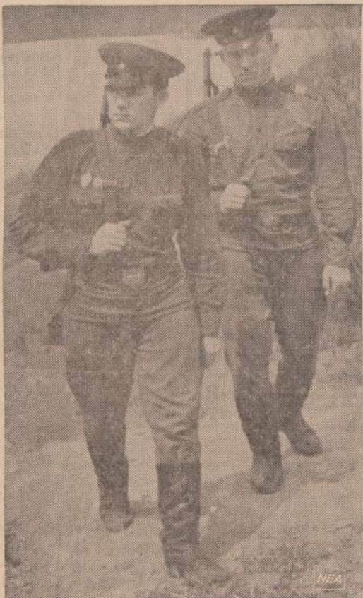
Sovietų spauda, kaip ir visos karinė jėga paremtos diktatūros, mėgsta spausdinti savo kariuomenas. Čia parodyti du "garbingieji pasienio žvalgiai" prie nedraugiškos Kinijos sienos, kur jau įvyko ne vienas kruvinas susirėmimas tarp dviejų "socialistinių" kariuomenų.

Queens miesto valdybos pirmininkas (Queens yra New Yorko miesto dalis, kurioje gyvena apie 2 milijonus gyventojų, jų tarpe daugumas New Yorko lietuvių) š. m. birželio 15-tąją dieną paskelbė masinių deportacijų iš Lietuvos, Latvijos ir Estijos priminimo dieną. Tokia proklamacija čia gauta iš viso pirmą kartą. Ji gauta Petero Wyteno pastangomis.