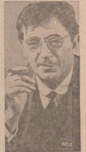
Hollywoodo aktorius Robert Mitchell, kuris visada turi labai vyriškų kario, lakūno ar "Laukinių Vakary" didvyrio vaidmenis, šį kartą vaidina Airijos mokytoja, kurio didžiausias pamėgimas rinkti laukines gėles ir jas džiulinti tarp knygos puslapių.

"NAUJIENOS" KIEKVIENO DARBO ŽMOGAUS DRAUGAS IR BŪČIULIS