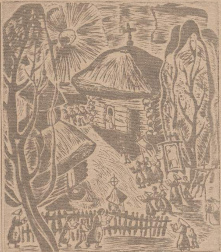
A. a. PAULIUS AUGIUS

Primityvieji indo-europiečiai kalbėję, galimas dalykas, viena kalba. Baltai iki Kristaus eros pradžios išbuvo kaip ir izoliuoti. Pirmieji keli šimtmečiai Kristaus eroje baltams buvę "Aukso amžiai" (the Golden Age of the Balts), jie buvo atžymėtinai metalo apdirbėjai šiaurės ir rytų Europoje. Tuo laiku baltai buvo išsiplėtę iki šiaurinės ir centrinės Rusijos nuo Uralo iki Volgos, nuo Dauguvos iki Vyslos.