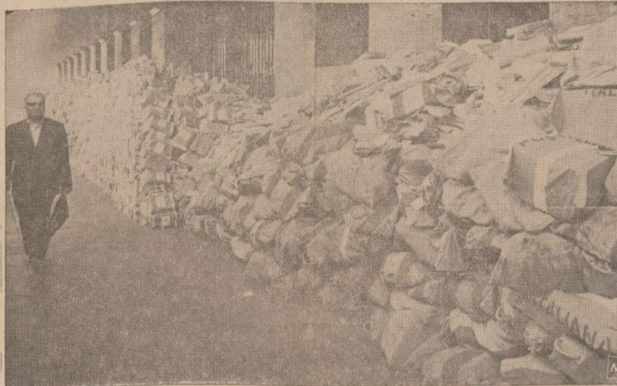
Italijos pašto tarnautojai paskelbė streiką ir jo rezultatai matosi Romos geležinkelio stotyje, kur susikrovė mašinos su laiškais ir siuntiniais.

Tuo būdu liėpos 16 d. bus atmintina Amerikos ir viso pasaulio istorijoje. Spauda primena, kad liėpos 16 d. 1945 metais įvyko kitas labai svarbus žmogui įvykis. Tą dieną Alamogordo dykumoje, Naujoje Meksikoje buvo sėkmingai išbandyta pirmą atominė bomba.