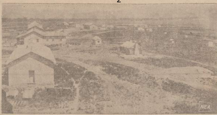
Šitai atrodė Ft. Sill 1873 metais. Keirėje matome pirmą Ft. Sill pašto įstaigą. Savo laiku čia gyveno indėnų apašių vadas Geronimo. Jis buvo sumistas, laikytas vietos kalėjime, o kai mirė, tai čia pat ir palaidotas.

amerikiečių maną, jog religija praranda įtaką į gyvenimą, o 14 nuosimčių tik, kad religijos įtaka didėja. Šie duomenys esą visiškai priešingi 1957 metais prarastam apklausinėjimui, kuomet tik 14 nuosimčių teigė, jog religija praranda įtaką, o 69 nuosimčiai — kad jos įtaka didėja. Daugumas katalikų dabar esą smerkimą dėl popiežiaus užsispyrimo prieš gimdymų kontrolę ir dėl didėjančios bažnyčioje prarasto tarp liberalinės ir konservacinės frakcijų. Kolegių studentų tarpe net 78 nuosimčiai tvirtina, kad religija "netenka grunto".