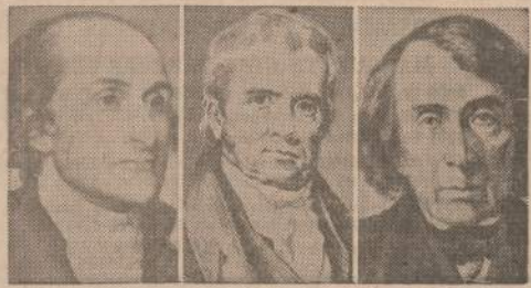
Amerika turėjo daug garsių Aukščiausiojo Teismo pirmininkų. Kai-reje: John Jay buvo pirmasis (1789-95). Viduryje: John Marshall (1801-35) padarė teismą pripažintu JAV konstitucijos aiškintoju ir Roger B. Taney, kuriam teko nelengvos teismo pareigos prieš civilinį karą (1836-64).