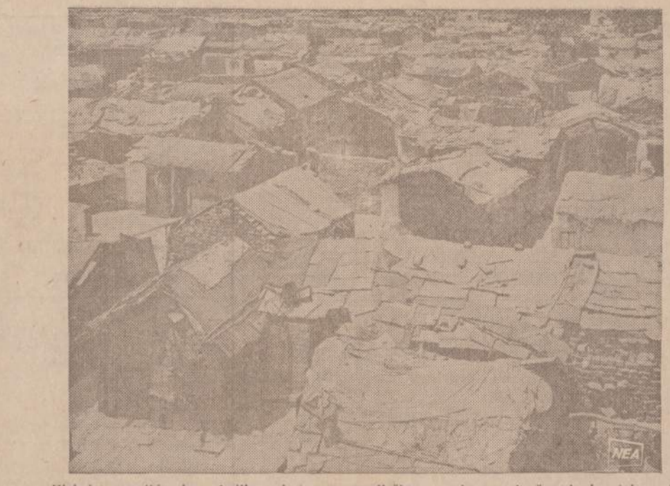
Kiekviename didesniame Indijos mieste yra nepaliečiamų nusigyvenusių žmonių kvartalas. Pa- veiksle matome tokių nepaliečiamųjų guolį gatvėse. Konstitucija kiekvienam Indijos piliečiui davė lygias teises, bet nepaliečiamieji neturi teisės į žemę ir kartu su kitais pasimesti.

Seniau ežerų Lietuvoje buvo žymiai daugiau. Šiuo metu turi- me apie dvidešimt tūkstančių pelkių, užimančių apie penkis šimtus tūkstančių hektarų. Ma- noma, kad daugiau kaip du treč-