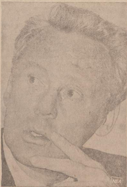
Iki šio mėto kino aktorius Van Johnson vaidindavo miestų ir kaimų jaunuolį, bet dabar jis pareiškė, kad sekantį filmą jis vaidins prezidentą James Garfieldą.

8. Kiekvienoje bendruomenėje, kaip ir dažnose šeimose, pasitaiko žmonių, su kuriais beveik neįmanoma dirbti. Jie sudaro nedidelį procentą, bet jų vis vien negalima pamiršti. Jie mėg-