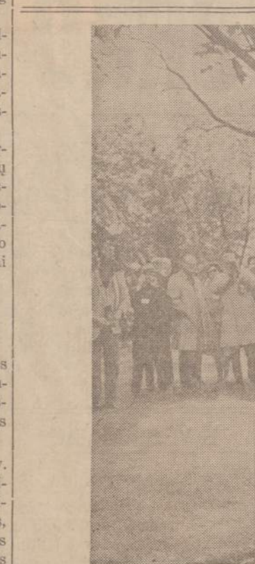
Prezidentas Kennedy Kanadoje 1961 metais pasodino nedidelį žuolūką ant Ottavos Parlamento kalno. Dabar medis jau gerokai pa-ūgėjo. Prie jo kasdien stovi Raitosios Kanados Policijos sargybinis.

BIZNIERIAI, KURIE GARSINASI "NAUJIEŅOSE" — TURI GERIAUSIA PASISEKIMA BIZNYJE