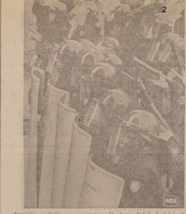
Japonijos policija yra gerai paruošta ir aprūpinta įvairiais "ginklais" kovoms prieš studentų riaušes. Policija turi skydus, šalmus, dujokaukes ir dujų granatoms šautuvus.