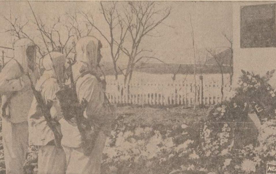
Sovietai jau sėpėjo paslėpti paminklų kareiviams kovo mėnesį žuvusiems kovose su kinais prie Damaskio salos. Paminklo lentoje surašytos žuvusių sargybiniai ateina aplankyti draugu, žuvusių nuo kitos komunistinės valstybės kulkų.

New Yorko meras Lindsay pranešė, kad jis steigsiąs naują politinę partiją — miestiečių partiją. Rudenį jis dalyvaus rinkimuose, kaip liberalų ir nepartinį atstovas.