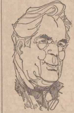
Warren Earl Burger, naujas Aukščiausiojo JAV Teismo pirmininkas

Komunistai grasina naujam prezidentui PARYZIUS. — Prancūzijos komunistų laikraštis įspėjo naują prezidentą Pompidou, kad komunistai reikalaua iš naujos vyriausybės įvairių socialinių pagerinimų. Komunistų partija agitavo visus už Pompidou nebusuotį ir rinkimuose nedalyvauti. Dabar, nors jų agitavimas tikslo nepasiekė, jie tvirtina, kad 31% prancūzų nedavė prezidentui teisės kalbėti jų vardu. Rudenį Prancūzija gali tikėtis naujų streikų ir darbininkų reikalavimų. Naujos vyriausybės pats sunkiausias uždavinys ir bus išlaikyti sveiką valiutą, kuri nėra labai stipri ir kartu neprileisti prie ekonominės krizės, kuri gali kilti prasidėjus streikams ir kritus produkcijai.