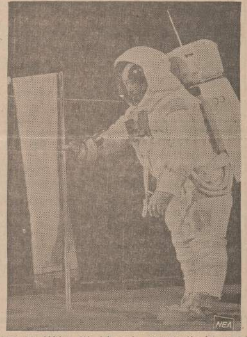
Astronautas Aldrinas Mėnulyje turės pastatyti vėjo, jei ten toks bus, matavimo instrumentą.