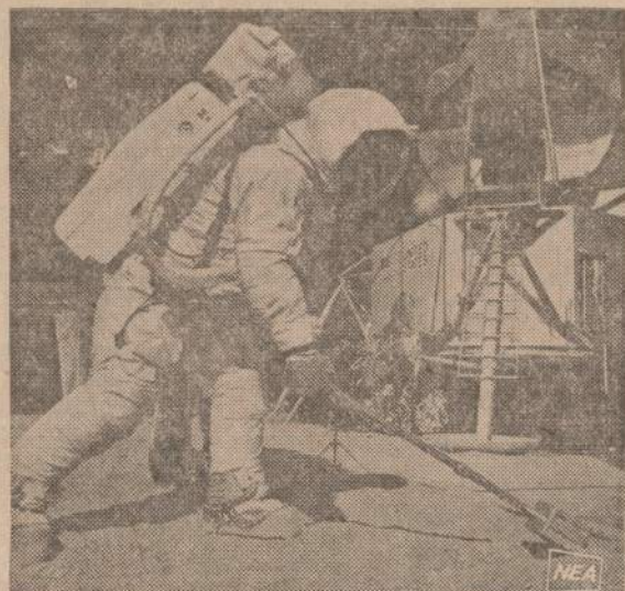
Specialius šaukštas bus naudojamas surinkti mėnulių paviršiuje esančių medžiagų pavyzdžius, kurie bus vėliau atgabenti žemėn.