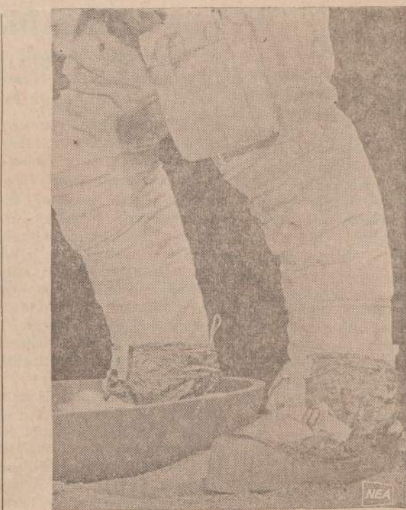
Šitaip atrodo pirmosios žmogaus kojos, palietusios Mėnulio paviršių. Dešinė astronauto koja įstatyta į nusileidimo laivo kojos lėktuvą.

Purkajevs pranešimą tuojau perdaviau Narkomui (narodno-