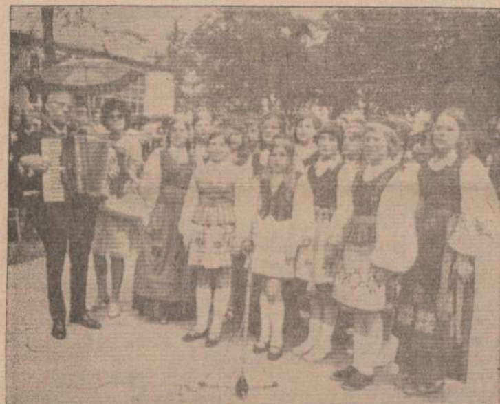
Vasario 16 gimnazijos mokinių choras