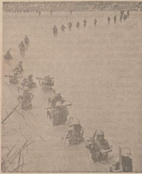
JAV marinų kareiviai keliasi per negilią, tačiau plačią Vu Gia upę netoli Da Nango. Svarbiausias marinų rūpestis, kaip išlikti sausą šautuvą.

Paklausus, kodėl neišrašoma į lietuvių bendruomenę, tenka nekartą išgirsti, kad tai, esą tik katalikų bendruomenė. Tą įspūdį nelaimingai pastiprino tik vieno evangeliko, o iš kitos pusės 5 katalikų kunigų išrinkimai į Tarybą. Tai įvyko dėl to, kad frontininkai ir jų pasekėjai į rinkimusėjo po katalikybės vėliava, savo bloku suteikdami "Katalikų pasauliečių tarybos" vardą. Todėl katalikai rinkėjai buvo lyg ir priversti rinkti saviškius, o evangelikai, kurių bendruomenėje yra mažuma, rinko vėl savus, bet šie neįėjo į tarybą.