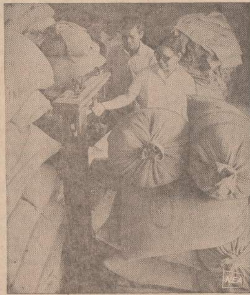
Naujieji ryžių rūši labai pakėlė Filipinų ūkininkų derlių. Tarptautinis Ryžių institutas, remiamas Amerikos Fordo ir Rockefellerio Fondų, tikisi įvesti naują ryžių rūšį į visas Azijos šalis.

STOKHOLMAS. — Dar šeši amerikiečiai gavo Švedijoje politinę globą. Jie, bijodami tarnauti kariuomenėje Vietname, pasislėpė Švedijoje.