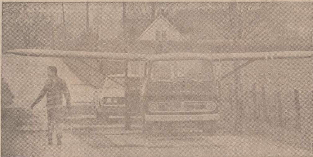
Paveiksle matomas ne sparnuotas sunkvežimis, bet jo tempiamas sportinis lėktuvas, kuris buvo priverstas ne vietoje nusileisti Indianos ūkininko pievoje.

CHIRURGAS 2454 WEST 71st STREET Ofiso telefonai: HEmlOCK 4-2123 Rezid. telefonai: GIBson 8-6195 Pirma liguonis pagal susitarimą. Dėl valandos skambinti telefonu HE 4-2123 jei neatsiliepiama, tai telef. GI 8-6195