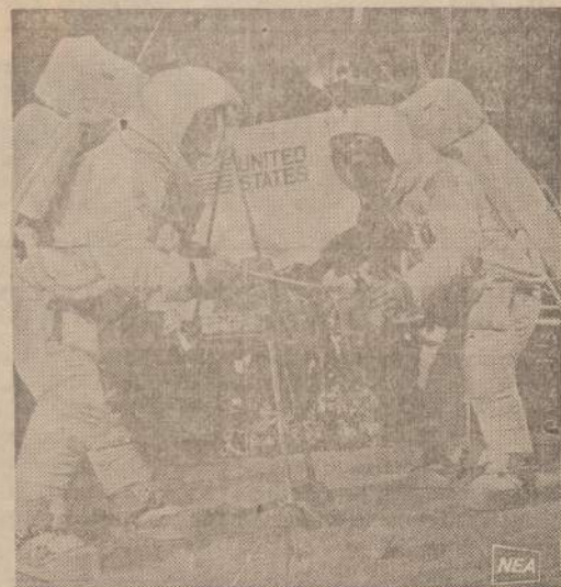
Astronautai praktikuojasi Houstono Erdvės Tyrimų Centre kelionei į Mėnulį. Ant nugaros astronautai turi deguonies, spaudimo ir temperatūros kontrolės aparatus.

Ar ne laikas jau būtų jiems griežtis kokio nors naudingo darbo? Birželis