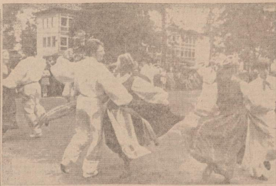
Publika buvo sužavėta tautiniais šokiais, kuriuos su dideliu gyvumu pateikė lietuvių gimnazijos grupė, rašo Weinheimer Nachrichten.

"NAUJIENOS" KIEKVIENO DARBO ŽMOGAUS DRAUGAS IR BICIULIS