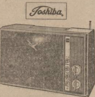
Toshiba Sun Screen Portable TV, UHF-VHF. The Sun Valley Model V4. Striking new Toshiba snap-on "Sun Screen" filter for glare-proof outdoor viewing. 75 square inch rectangular picture. "Portabuilt" to withstand jolts and jars. "Shieldguard" picture tube. Copper etched circuitry. Private earphone. Charcoal high impact cabinet with silver-chrome trim. $9.95