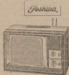
Toshiba Rectangular Color Portable TV, UHF-VHF. The Spectrum II Model C2A. 59 square inches. New "Spectronic" color picture tube for incredible clarity, detail. TintMaster slide rule color tuning. A snappy 29 lb. take-along, "Portabuilt" to take the jolts and jars. Precision-crafted copper etched circuitry. Automatic degaussing. Charcoal linen-textured vinyl finish, silver-chrome trim. (Also as The Spectrum III C3A. In Cocoa vinyl finish, golden-chrome trim.) $229.95

DIDELIS PASIRINKIMAS medžiagų ir visų kitų Lietuvoje pagedidėjusių prekių labai prienamomis, žemesnėmis negu kitur kainomis. KREIPKITES į mūsų vienintelę Chicagoje lietuvių įstaigą, turinčią teisę SAVO VARDU siųsti siuntinius tiesiai iš Chicago į Lietuvą. Vedėjai: E. ir V. ZUKAUSKAI