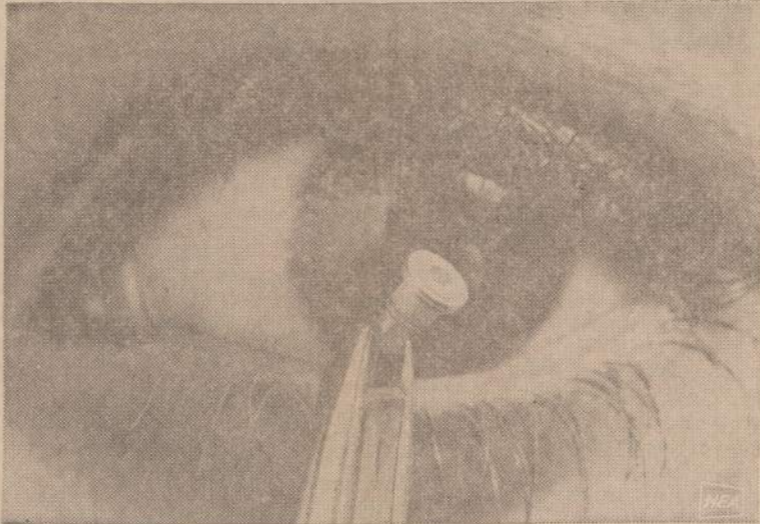
Repėse laikoma "elektroninė akis" yra nedidelė, palyginus su žmogaus akimi. Ji tačiau, labai svarbi susižinimo ir nuotolio iėškojimo aparatuose. Per tą akį siunčiami laserio spinduliai išsūkia elektronų judėjimą, kuris aparatuose padaro 200 kartų jautresnius už ankstesnius pa-našius instrumentus.

galėjo jau prieš trejis metus mirti ir, jo nuomone, iki šiol išgyveno tik didelės laimės dėka. Raminančios tabletės, energija duodančios tabletės, kitos: apėti kontroluojančios ir migdančios, nutraukė talentingos dainininkės gyvenimą.