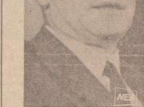
Prancūzijos naujas premjeras Jacques Chaban-Delmas vadovaus iš įvairių degolininkų grupių sudarytai vyriausybei.

Šiaurės Vietnamo komunistai vadai bando išlaikyti neutralumą Maskvos-Pekino konflikte. Nuo 1965 metų, kada Maskva pradėjo siųsti masines ginklų siuntas šiaurės Vietnamui, santykiai tarp Hanojaus ir Maskvos pagerėjo ir Maskva, įleidama į Hanojaus padėtį, nesipriešina Hanojaus neutralumui. Maskvai daug geriau, kad Hanojus neutralus, negu jis atvirai pereitų į Kinijos pusę.