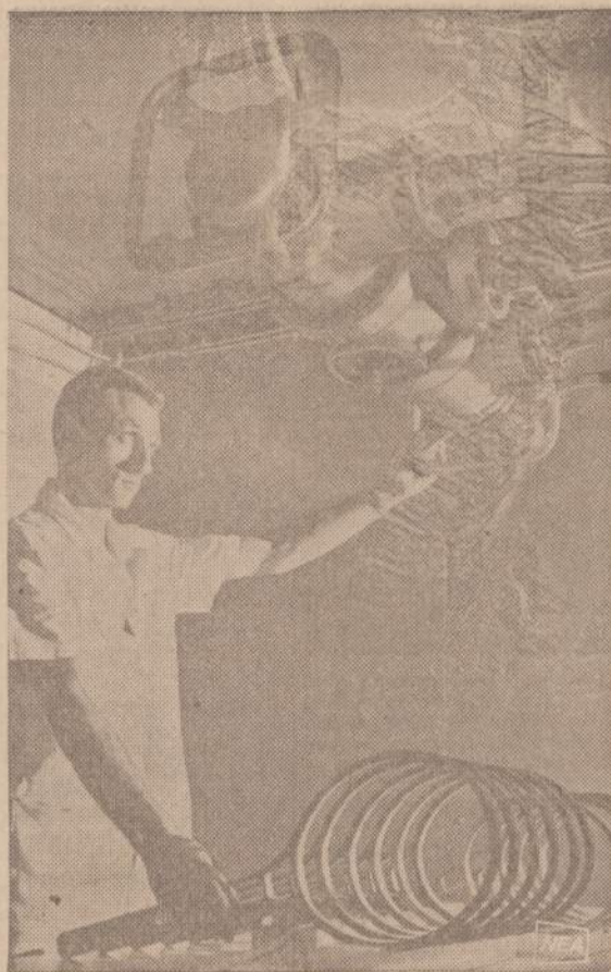
Teniso raketės pradėta gaminti iš lengvo metalo lydinio. Inspekto- rius raketes patikrina specialiais spinduliais, kad jose nebūtų oro burbulų ar kitų netikslumų.