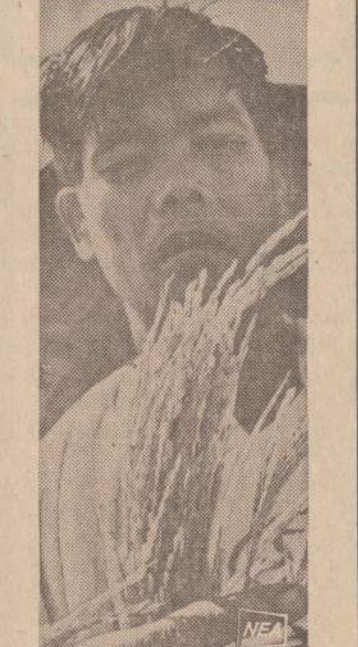
Filipinietis ūkininkas apžiūri naują ryžių rūšį, vadinamą IR-5. Ji duoda daug didesnę derlių už senas atmainas ir greičiau laukuose sunoksta.