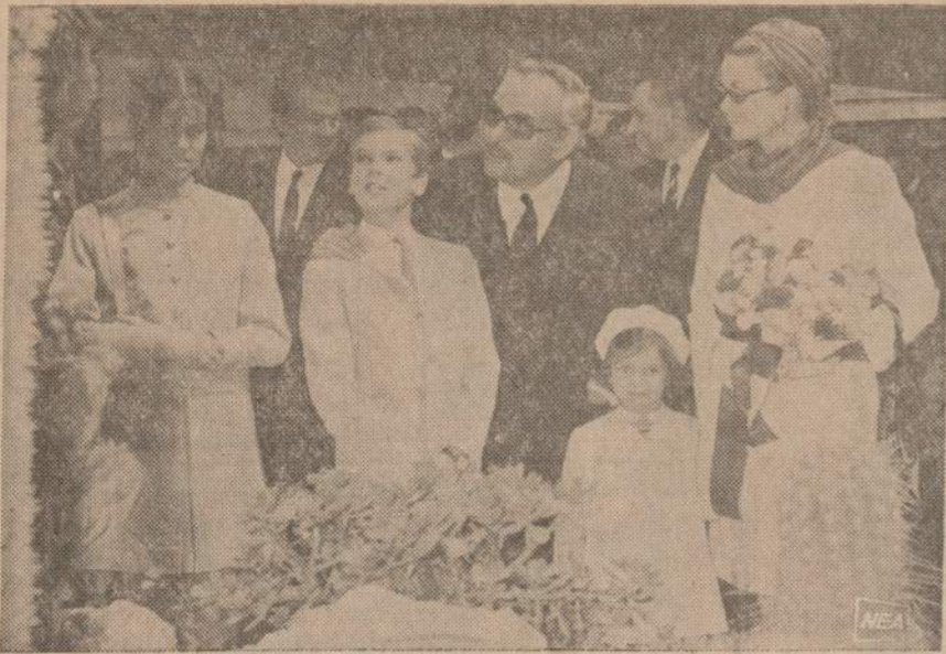
Karališkoji Monako šeima apžiūri Paryžiaus gėlių parodoje savo valstybės paviljoną. Iš kairės: princesė Karolina, princas Albertas, princas Rainier, princesė Stephanie ir buvusi Amerikos filmų žvaigždė princesė Grace (Kelly).