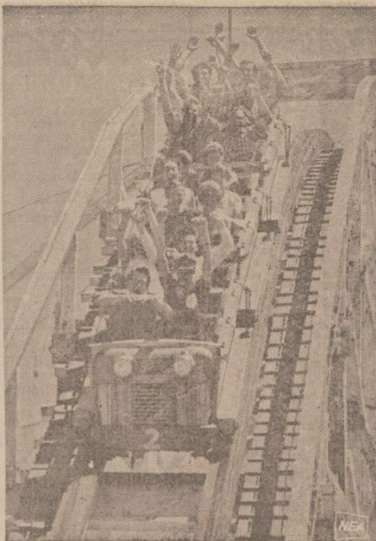
Pirmieji pasilinksminimo parku traukinėliai buvo išrasti Europoje, tačiau juos greit perėmė amerikiečiai, jie Amerikoje atsirado apie 1880 metus.

rių metalų lydiniai iš viršaus gražiai atrodo, bet po tuo grožiu, padantėse dažnai susitelkia daug akly vočių, kurios labai kenkia širdžiai. Šiandien nėra abejoje- nės, kad daugumą vidaus ligų sukelia užnuodyti, sugedę dan- tys.