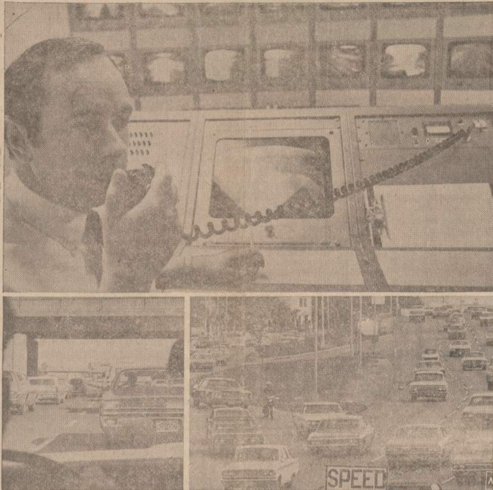
Atleityje visas gatvių eismas bus tvarkomas automatiniais komputeriais. Houstono, Texas eismo kontrolierius stebi automobilių judėjimą. Komputeriai "pastebi", kiek kurioje sankryžoje yra mašinų ir pagal tai jie patys uždega žalias arba raudonas šviesas. Jau šeši Amerikos miestai pradėjo varioti šią sistemą.

Saigono valdžia nurodo, jog jai reikia karo metu rūpintis savo gyventojų morale, todėl ji neįsigauna leidimo skristi, kaip anksčiau, per Kiniją.