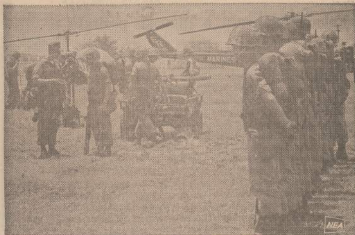
Puerto Rikoje įvykusiuose JAV kariuomenės manevruose dalyvavo ir marinių daliniai. Ameri-ka, kuri Vietnamo kare kiekviena kasdien laiko tik vienerius metus, jau turi apie tris milijonus Vietnamo karo veteranų. Nemažai jų yra ir marinių eilėse. Čia matomi mariniai dalyvavo neseniai pasibaigusiųose karo manevruose Puerto Riko saloje.

Skaitykite ir platinkite Dienraštį "NAUJIENAS" Jos visad rašo TEISYBĘ