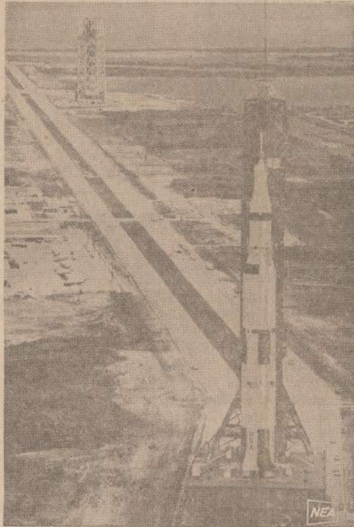
"Apollo 11" raketa ir erdvėlaivis jau gabenami į pakilimo vietą. Kelionė į Mėnulį prasidės liepos 16 d. Paveikslė matomas traktorius su raketa važiuoja tik viena mylia per valandą greičiu. Dešinėje parodomi "izoliacijos rūbai". Sugrįže iš Mėnulio astronautai turės tuos rūbus dėvėti, kol mokslininkai patikrins, ar jie neatsivežė kokių Mėnulio mikrobu.

PRAGA. — Uždarytos Čekoslovakijos studentų sąjungos vadai žada apeliuoti į parlamentą. Valdžia sąjungą uždraudė, nes ji veikusi prieš konstituciją ir valstybės interesus.