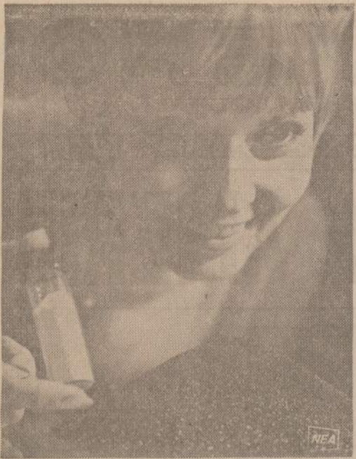
GE mokslininkai Amerikoje pagamino visai naują medžiagą iš borono nitrido, baltų miltelių, kuriuos paveikė laiko besisųpsanti techninė. Prieš jį gali kėvoti Borazon kristalų, kurie kainuoja 340 dolerių uncija. Tie kristalai bus vartojami metalų šilfavimo. Naujieji kristalai gaunami dideliame spaudime ir karštyje.

Kaip esu minėjęs čia anksčiau, seniūnijos yra sudaromos pagal Detroito miesto bei aplinkinių vietovių pašto zonas, arba, aiškiausiai kalbant, zip-code'o paskutinius du skaičius. Užtat ir turėjome paaiškinti, jog antroji 27-ta apylinkė jau yra Dearborn Heights). Tokiais retais atsitikimais LB vadovams siūlau prie skaičiaus pridėti raidę, tą antrąjį vienodo numerio apylinkę pavadinant "27 A."