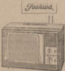
Toshiba Rectangular Color Portable TV. UHF-VHF. The Spectrum II. Model C2A. 69 square inches. New "Spectronic" color picture tube for incredible clarity, detail. TintMaster slide rule color tuning. A snappy 39 lb. take-along. "Portable" to take the pits and jars. Precision-crafted copper etched circuitry. Automatic degussing. Charcoal lensed-textured vinyl finish, silver-chrome trim. (Also as The Spectrum III C3A. In Cocoa vinyl finish, golden-chrome trim.) $229,95

5115-5123 So. Kedzie Ave. PRospect 6 - 1790 OPEN MONDAY AND THURSDAY EVENINGS