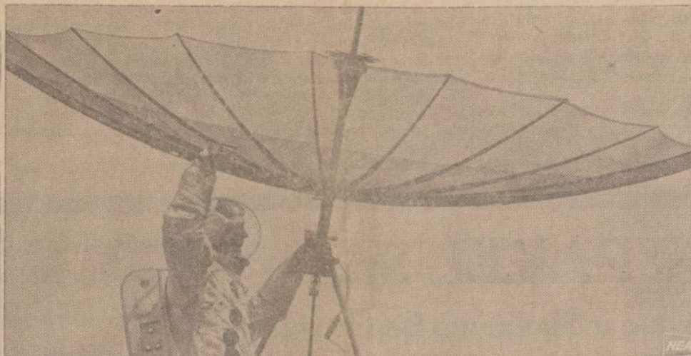
Astronautai į mėnulį nusigabens ir šį "lietsargį", kuris skirtas persiųsti signalams. Ši antena pagaminta iš labai plenos, paauskuotos vielos, kurios ilgis siekia 38 mylias.

LONDONAS. — šeši valai teismo buvo nuteisti nuo trijų iki 5 mėn. kalėjimo už priklausymą nelegalioms karinėms organizacijoms ir ginklų nešiojimą.