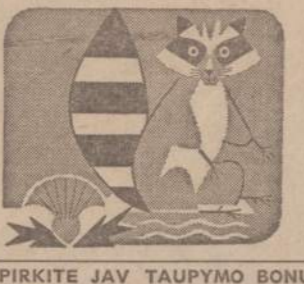
PIRKITE JAV TAUPYMO BONUS