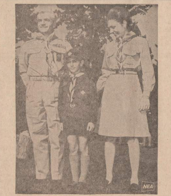
Persijos arba Irano šachas yra vyriausias to krašto skautų vadas. Šalia jo stovi sosto įpėdinis princas Ali Reza dar tik "vilkiukas" ir jo motina, karalienė Farah, irgi skautės uniformoje.