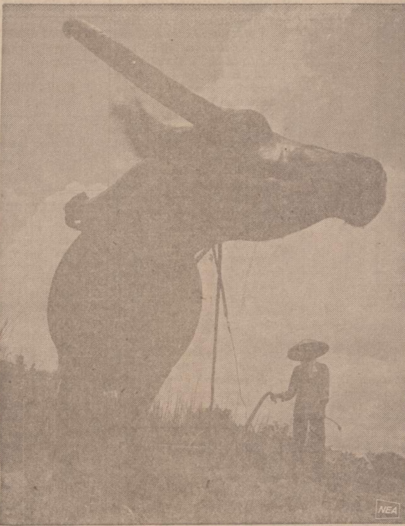
Filipinuose ūkininkai ryžių laukus ašia vandeninių buivolų, vadinamų karabaos.

The Peace Corps Agricultural Desk Washington, D. C. 20525 Please send me information. Please send me an application. Name _____ Address _____ City _____ State _____ Zip Code _____ Advertising contributed for the public good.