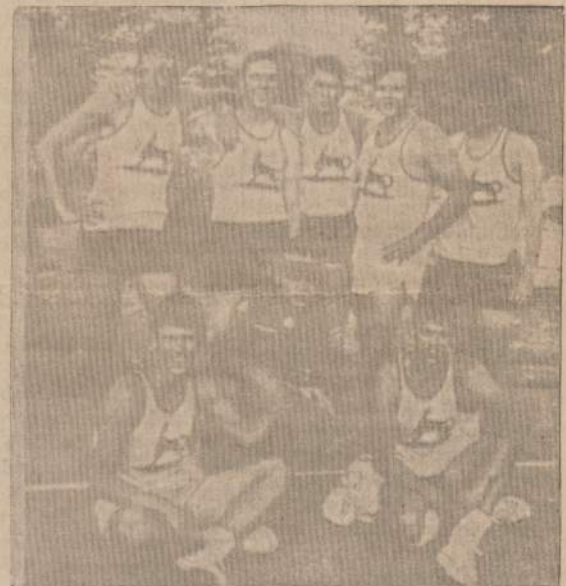
ATLANTO RAJONO SPORTO SVENTES LAIMETOJAI