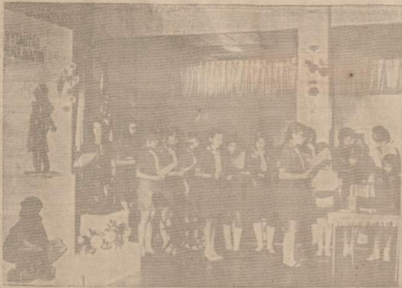
CLEVELANDIEČIAI TUREJO PROGOS PASIGROŽĖTI CLEVELANDO LIETUVIŲ DAILININKŲ PARODA

Gerb. Sukaktuvininkas nuo pat jaunų dienų yra susipratęs lietuvi-patriotas. Dar jaunystėje stojęs savanoriu į atsikuriantios Lietuvos kariuomenę,