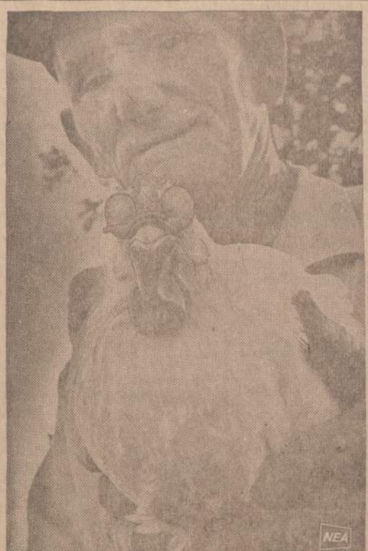
Vienas Pittsburgo, Kansas ūkininkas pastebėjo, kad jo vištos geriau mėgsta tarp savęs peštis, negu dėti klausinius. Jis joms uždėjo specialius akinius, kurie neleisdžia matyti, kas darosi priekyje. Vištos mato tik iš šonų. Klausinių produkcija pakilo.

1739 So. Halsted Street Chicago, Ill. 60608