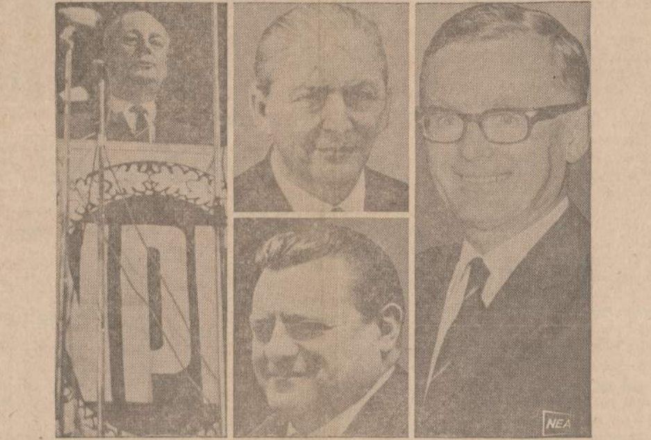
Šiandien Vakarų Vokietija yra viena stipriausių ir turtingiausių pasaulio valstybių, todėl jos politiku pareiškimai atidžiai išklaunami. Kairėje: Adolf von Thadden, Nacionalinės Demokratinės Partijos vadas, Europa stebėtojų naujųjų nacių partijos veiklą ir stiprėjimą. Viršuje kancleris Kurt Georg Kiesinger, krikščionių demokratų partijos vadas, apačioje įtakingas politikas, finansų ministras Franz Joseph Strauss ir dešinėje — ekonominių reikalų ministras Karl Schiller.

gyventojus, pasilikdamas sau teisę spręsti, kuriuos lėktuvus praleisti į Biafrą ir kuriuos numušti.