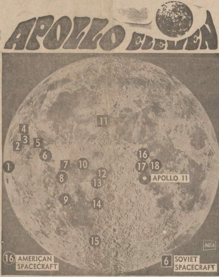
Šiame paveiksle Mėnulyje nurodytos vietos, kur nusileido "minkštai" ar sudužo įvairūs Amerikos ir Sovietų Sąjungos erdvėlaiviai. Jų atstojas žinios apie Mėnulį, jų atsistos fotografijos daug prisidėjo prie kelionės. Amerikiečiai į Mėnulį yra pasiuntę 16 Orbiterių, Surveyerių ir Rangerių, o sovietai 6 Lunas.

Septyni "Ra" įgulos nariai buvo paimti žvejų laivo "Shenandoah". "Ra" savo kelionę pradėjo iš Maroko gegužės 26 dieną. Iki Barbados salų dar jai buvo rėjo įrodyti, kad egiptiečiai dar prieš Kolumbą savo lengvais laivais galėjo nuplaukti į Ameriką ir ten palikti savo kultūros