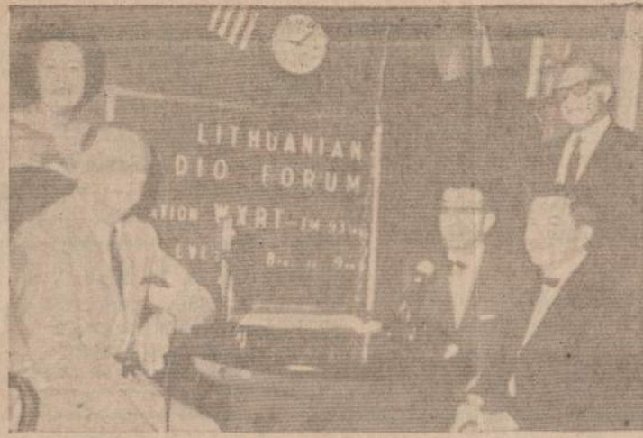
State of Illinois Lieut. Governor Paul Simon buvo Garbės Svečias-Kalbėtojas Lietuvių Radijo Forumo, liepos 5 d. Pasikalbėjime ir priėmimo dalyvavo...