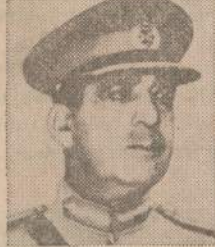
5 Pakistan Gen. Khan Aug. 1