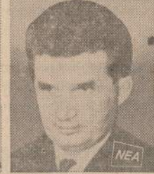
6 Romania Pres. Ceausescu Aug. 2