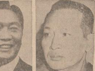
1 The Philippines Pres. Marcos July 26

Karinė Honduro valdžia dabar yra remiama visų politinių grupių, nors anksčiau valdžiai nebuvo duodama pakankamai lėšų ginklams pirkti.