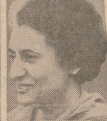
4 India Prem. Gandhi July 31