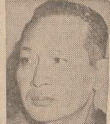
2 Indonesia Gen. Suharto July 27