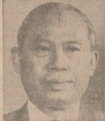
3 Thailand Prem. Kittikachorn July 28, 29, 30