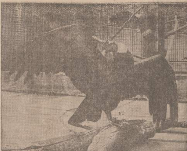
Andų kondorą galima pamatyti Lincoln zoologijos parke. Išplėsti jo sparnai siekia 115 colių. Jis gyvena aukštuose Čilii, Peru ir Kolumbijos kalnuose. Tai liepos mėnesio parinktas paukštis.

Taip kartais mes mėgstame pasijuokti iš savęs, o likimas