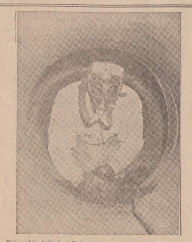
Šiais erdvių kelionių laikais galima pagalvoti, kad Žia matomas iš kitos planetos atvykęs astronautas. Iš tiesų tai dujų vamzdžių taisytojas. Tokių vamzdžių Amerikoje iš viso yra 600,000 mylių.