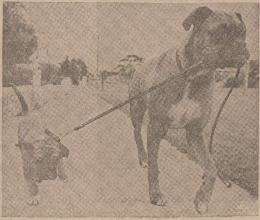
Šio Australijos jauno žunyčio savininkams nereikia jo vesti pasivaikščioti. Tas pareigas atlieka jo mama, nežiūrėdama, kad jaunikis atrodo, nelabai linkęs tolimesnei kelionei.