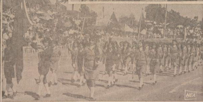
Moterys ilgai kovojo, kad gautų lygias teises su vyrais. Dabar jos tas teises turi. Sovietų Sąjungoje jos dirba sunkiausius kelių konstrukcijos, statybos ir kasykų darbus, kurie civilizacijoje pasauliui dirbami tik vyru. Daug kur moterys tarnauja kariuomenėje. Viršuje, kairėje matoma Izraelio merginai, išrikuotas ginklu patikrinimui, dešinėje — arabų moterys partizanės, viduryje Viet Congo moterys Pietų Vietnamo, o apačioje — turkų merginos žygiuoja Kipro saloje.