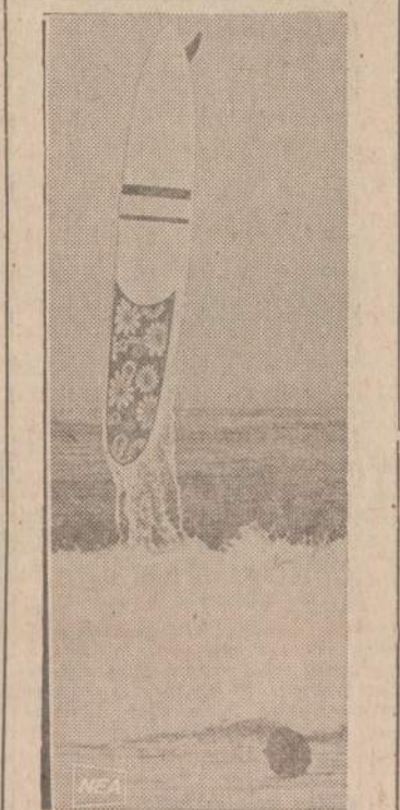
Bangu jėjimo lenta prie Capa Code krantų nuskrido sau, o jos savininkas — sau, šis sportas darosi vis populiaresnis ne tik Ramiajame vandenyne, bet ir JAV rytuose.