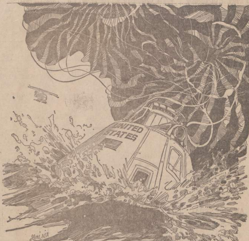
Šitaip dailininkas įsivaizduoja Apollo 11 nusileidimą į vandenį. Įvairių spalvų parašytų buvo aštuoni. Jie pristabdė kritimo greitį.

2454 WEST 71st STREET Ofiso telefonai: HEMlock 4-2123 Rezid. telefonai: GIBson 8-6195 Pirma ligonius pagal susitarimą. Dėl valandos skambinti telefonu HE 4-2123 jei neatiliepiama, tai telefon. GI 8-6195