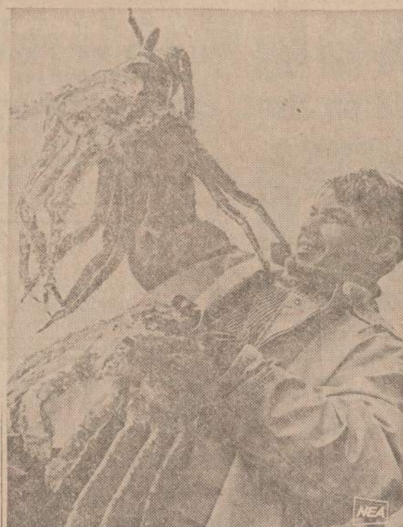
Aljaskos žvejys džiaugiasi pagaves du didelius jūros krabus. Jūs reikia mokėti paimti j rankas, nes jų žnyplės pavojingos