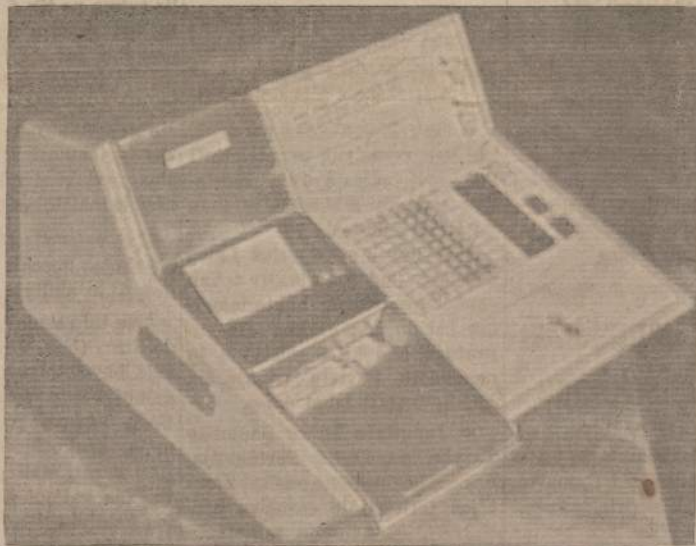
Naujausias automatinis kompiuteris

Antras svarbus prezidento pranešimas sako, kad Chicago Taupymo Bendrovė yra viena mažo skaičiaus taupymo bendrovių, turinčių 100% pilnai automatišką rekordų tvarkymo sistemą, vadinamą On Line Electronic Processing System.