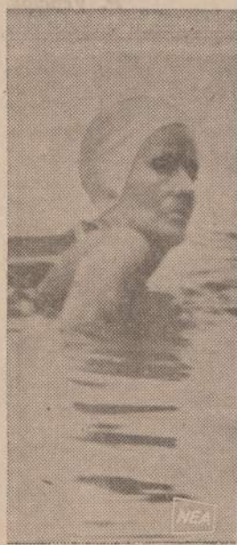
Vyresnio amžiaus žmonės gerai atsi- mena filmu aktore Greta Garbo. Ji jau seniai labai vengia fotografų, ta- čiau vienam jų pavyko ją sugauti besimaudančią Prancūzijos Riviero- je, kur ji atostogauja.

— Nežinau, kaip Londone da- ro, bet, jei taip atsitiktų pas mus Škotijoje, aš nusimačiau kepu- rę ir pasakyčiau, kad atėjau au- kų rinkti. Minia bereginti pati iš- siskirstytų, — paaiškino kandi- datas.