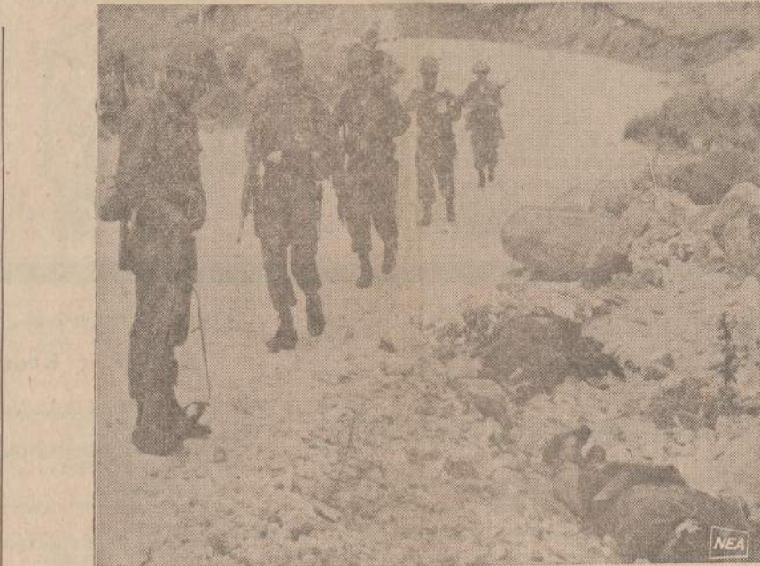
Honduro kareiviai nusifotografavo prie dviejų žuvusių salvadoriečių lavonų. Krizė Centrinėje Amerikoje nesumažėjo, nes Salvadoras atsisako išvesti savo kariuomenę iš Honduro teritorijos.

Kitą dieną 12 valstybių ministrai pristatė kitą rezoliuciją, reikalaujančią, kad Salvadora prekių nepirktų jokia Amerikos valstybė: kavos, žibalo, medvilnės ir cukraus. Šitokia griežta rezoliucija tuoj suminkštino Salvadora diplomatus. Jie pasitarė ir užsienio reikalų ministras trumpai pranešė, kad