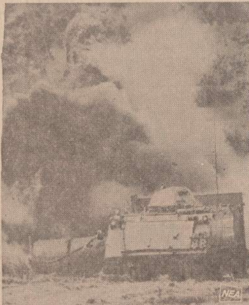
Australijos kareiviai Vietnamo sugalvojo naują būdą, kaip išsproginti komunistų pakastas minas. Jie prie tanko pritaikė cementinį vamzį, kuris velkamas užgauna minas ir jas sunaikina.

Vietnamo komunistai sako, kad prezidento Nixono kelionė į Saigoną bus skirta sustiprinti smunkančių kareivių moralę Pietų Vietnamo kariuomenėje.