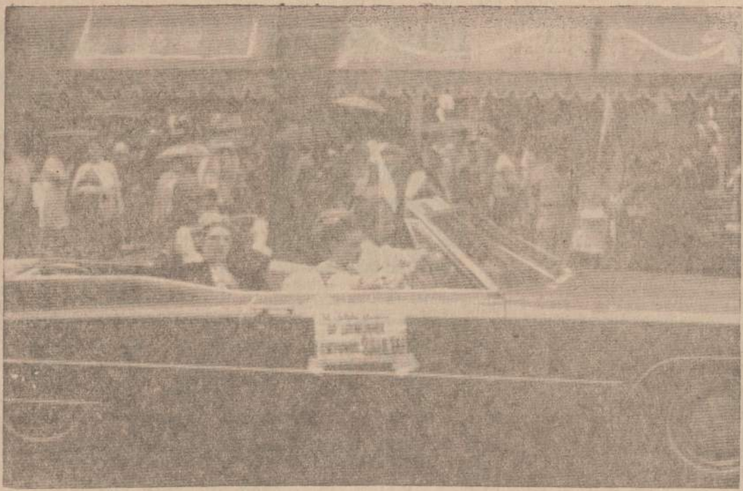
Lietuvos šaulių Sąjungos Centro Valdybos ir Chicago's Vytauto D. kooops vadovybės nariai Pavergtų Tautų paradede saliuotodami pravažiuoja pro tribūną State gatvėje, Chicagoje.