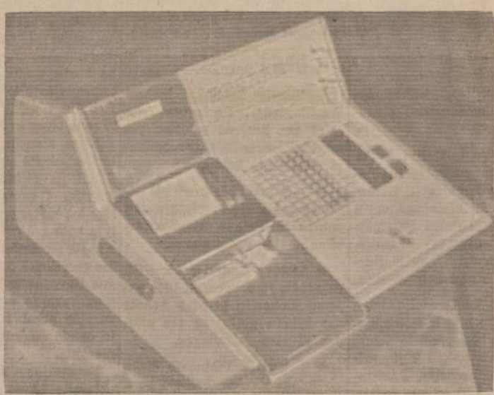
Naujausias automatinis kompiuteris

Antras svarbus prezidento pranešimas sako, kad Chicago Taupymo Bendrovė yra viena mažo skaičiaus taupymo bendrovių, turinčių 100% pilnai automatišką rekordų tvarkymo sistemą, vadinamą On Line Electronic Processing System.