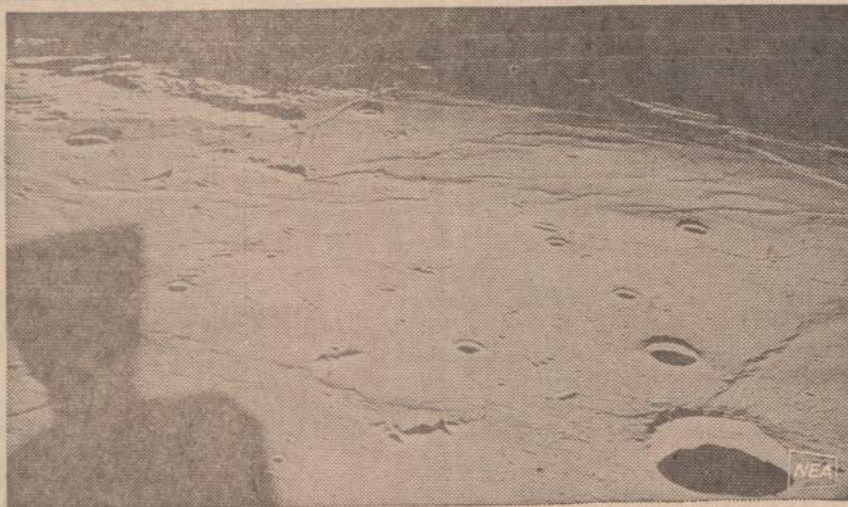
Mėnulio fotografija, padaryta astronautų, kada jų laivas dar stovėjo mėnulyje. Kairėje mato mas to laivo šešėlis.

REMKITE TUOS BIZNIERIUS, KURIE GARSINASI "NAUJIENOSE"