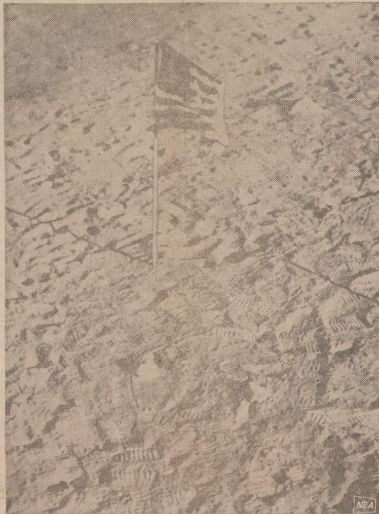
Amerikos vėliava ir astronautų Neil Armstrongo ir Edvino Aldrino pėdos Mėnulyje. Vėliava lyg plevėsuoja, tačiau ją ištempė laiko specialii spyruoklė, nes Mėnulyje nėra atmosferos ir vėjo.

VENGRIJA. — Čia vaikų alkoholizmas sudaro nemažą problemą. Laikraštis Magyar Hirlap praneša, jog per pusantį metų gydymo centrui priėmė virš 4,300 pasigėrusių vaikų.