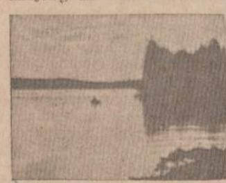
Civilizacija pareina į džugles. Šventas šiaurės miškų ežerų ramybės sūdrumstės motorlaivis.

Kai darbo savaitė bebus 30 valandų ir vasaros atostogos mažiausiai po mėnesį, ir kai 320 milijonų amerikiečių, savo rekreacijos rezervacijose netilpdami išsilis per Kanados sienas ir pačių kanadiečių jau bus 50 milijonų, ak tuomet šiaurės