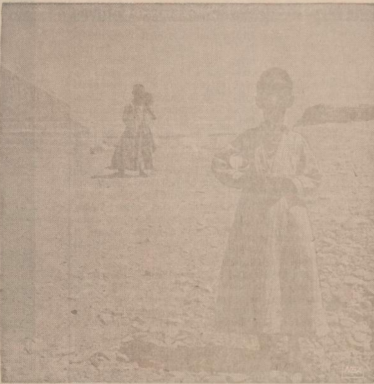
Nubiečių vaikai greit pripranta prie naujų gyvenimo sąlygų. Egiptas turėjo perkelti 45.000 nubiečių nuo Nilo pakrančių į dykumas, nes naujos Asvano užtvankos vanduo apėmė senus kaimus.

Šis antras puolimas pasirodė beveik 10 metų vėliau. Vyt. Meškauskas "Naujienu"