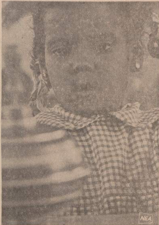
Nubietė mergaitė Egipte išžiūrėjusi į naują žaislą, parūpintą vaikų darželiui UNICEF organizacijos. Ši vaiku globos agentūra įsteigė Egipte 26 mokyklas, tris mokytojų seminarijas ir vaikų kliniką.

Taip apytikriai nustatyta riba per didokus miškų plotus, per dykras ir pagal vandens takus buvo nenatūrali siena. Ilgą laiką jos nepaisė, o patys gyvenventojai tiksliai jos ir nežinojo. Kovoms nutilus, jie skubėjo į savo senąsias gyvenvietes ir ėmėsi jas atstatyti. Kitur, iškirte ir išdeginę krūmais ir medžiais apaugusius plotus, naujai kūrėsi. Tokioje skubios kolonizacijos eigoje lietuviai, iš vienos ir kitos pusės, peržengė numatytas valstybių ribas. Pav., Kauno apygardos val-