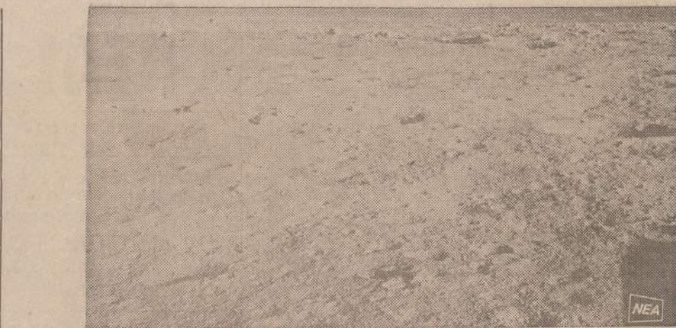
Ramybės jūra Mėnulyje, kur lankėsi Amerikos astronautai. Mokslininkai, apžiūrėję Mėnulio ir Marsio fotografijas, nutarė, kad nėra kitos tokios gražios planetos, kaip mūsų senoji Žemė.