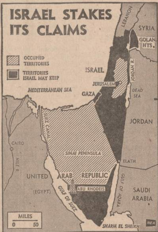
Izraelio darbo partija, kuri sudaro ir daugumą vyriausybėje, paskelbė, kokias žemes Izraelis numato pasilaikyti. Arabams nebus gražintos Golano aukštumos, Gazos pakraštys ir Sinajaus pusiasalio pietinis kampas, iš kur Egiptas kontroliuodavo įplaukimą į Akabos įlanką.

Houstone 24 pelių skrodimas parodė, kad jos jokių efektų iš Mėnulio dulkių negavo. Trys astronautai iš karantino bus paleisti numatytą dieną.