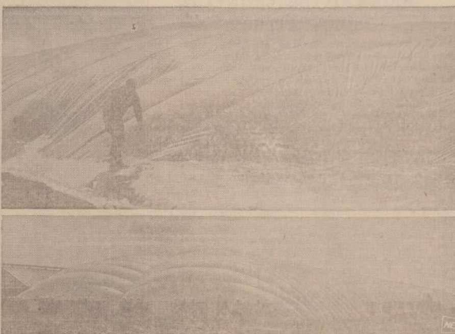
Plastinė medžiaga Amerikoje vis plačiau naudojama. Paveiksle matomi nauji šiltdaržiai, pastatyti iš oro pri- stūpų plastinių drobulių. Šitoks šiltdaržis Wooster, Ohio daržininkui kainavo tik aštuondalis to, ką būtų kainavęs stiklinis. Goodyear inžinieriai tvirtina, kad tokiais pastogėmis bus galima apdengti išsirus kaimus.

"Tėviškės Žiburii" redakto- rius tur būt žino, kad statant namą mūrininkas deda plytas, stalius atlieka medžio darbus ir t. t. Praktikoje bet kokį sudėtin-