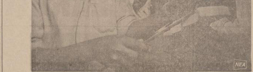
Nubičių vaikai Egipte mokomi įvairių amatų, jų tarpe staliaus, nors miško medžiagos Egipte labai mažai.

Individualinės ŠALFASS-gos pirmenybės vyks šeštadienį, rugpjūčio 30 d.; pradžia — 12 val. Varžybos bus prarvestos vyrų ir jaunių (žemiau 20 m.) klasėse.