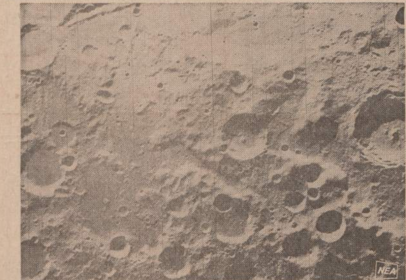
Mėnulio paveikslas, darytas 1967 metais Orbiter 4 kamerų iš 2,180 mylių atstumo, rodo pavir-šiaus panašumą į Marso nuotraukas.

Nepaisant bado, maro, paviet-rės, ugnies ir karo ir kitokių gamtos katastrofų, 98 nuosim-čių žmonių miršta lovoje. Dėlto, kas nenori mirti, neprivalo gul-ti į lovą.