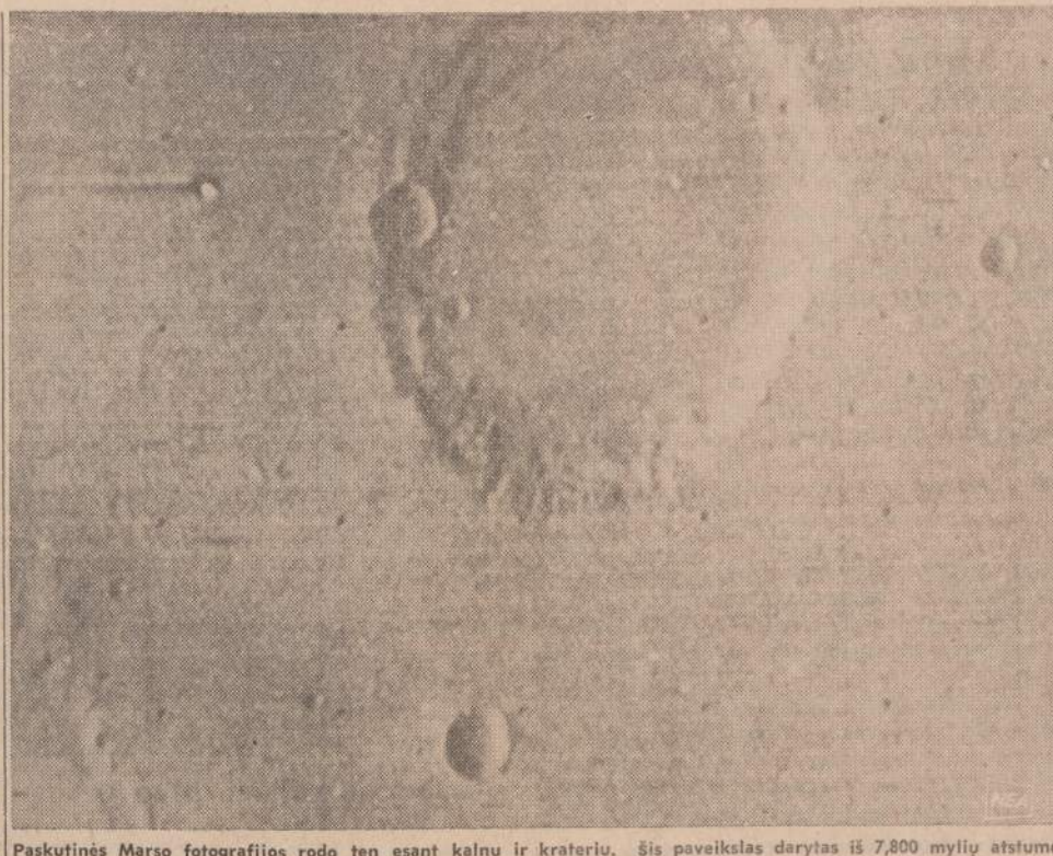
Paskutinės Marso fotografijos rodo ten esant kalnų ir kraterių. Šis paveikslas darytas iš 7,800 mylių atstumo.

Pačiu pagrindiniu straipsniu vis dėlto tenka laikyti "Per dainą į pelenus". Šiame straipsnyje išsamiai nagrinėjama vadinamoji bendradarbiavimo problema, kuri dar