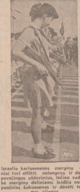
Izraelio kariuomenės merginų daliniai turi atlikti nelengvus ir dažnai pavojingus uždavinius, tačiau vadovybė merginų daliniams leidžia nešioti puošnius šukuosenas ir dėvėti trumpus sijonus.

Vakar prezidentas pasirašė pajamų mokesčių specialaus 10% priedo pratęsimą iki šių metų galo. Po to mokesčiai taps tik 5% iki liepos, kada visai bus atšaukti.