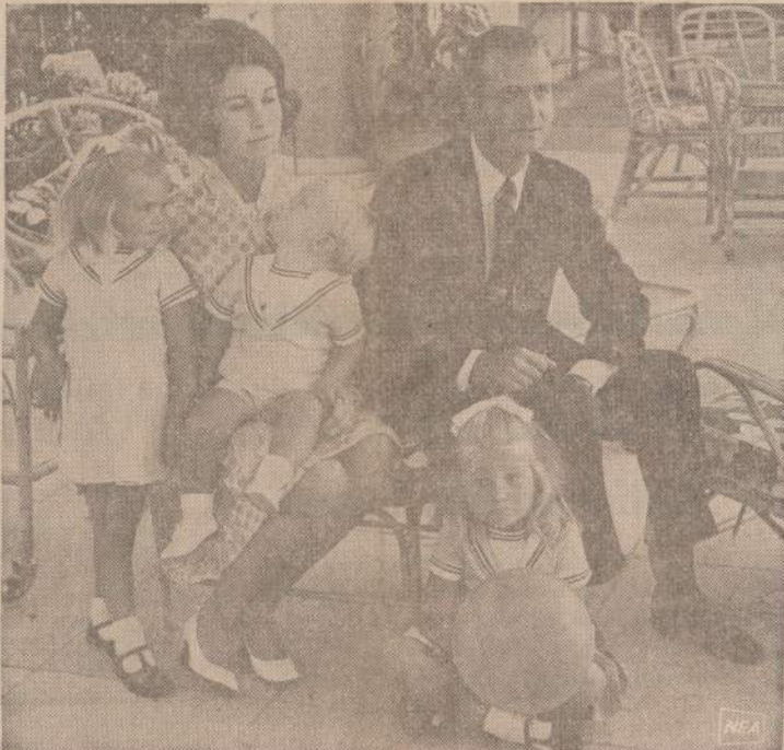
Ispanijos diktatorius Franco neseniai paskyrė savo įpėdiniu paskutinio Ispanijos karaliaus anūką, kurio pilnas titulas yra princas Juan Carlos de Borbon y Borbon. Šioje nuotraukoje iš kairės: princesė Kristina, princesė Sofija iš Graikijos su princu Felipe ant kelio. Šiuo pozavimu, atrodo, nelabai patenkinta princesė Elena, sėdinti ant žemės.

Rumunija per paskutinius metus smarkiai plėtė pramonę, geležies, plieno, mašinų, naftos ir chemijos, tačiau 22% krašto gamybos vis dar sudaro žemės ūkio ir miškų ūkio produktai. Amerikai bus nelengva surasti, ką iš Rumunijos pirkti.