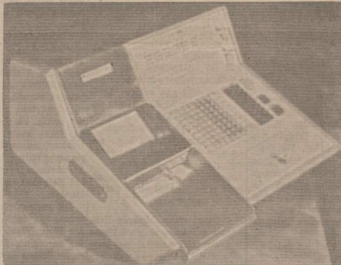
Naujausias automatinis kompiuteris

Antras svarbus prezidento pranešimas sako, kad Chicago Taupymo Bendrovė yra viena mažo skaičiaus taupymo bendrovių, turinčių 100% pilnai automatišką rekordų tvarkymo sistemą, vadinamą On Line Electronic Processing System.