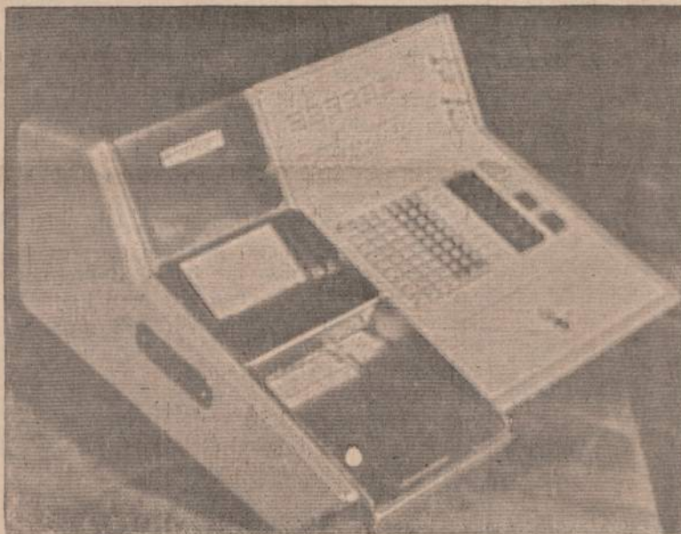
Naujausias automatinis kompiuteris

Antras svarbus prezidento pranešimas sako, kad Chicago Taupymo Bendrovė yra viena mažiausia taupymo bendrovių, turinčių 100% pilnai automatišką rekordų tvarkymo sistemą, vadinamą On Line Electronic Processing System.