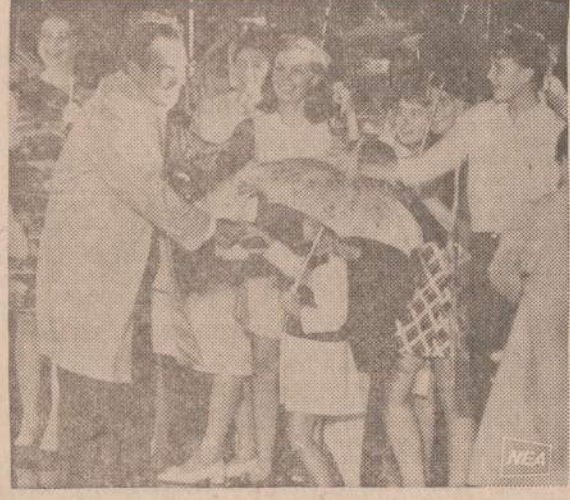
Prezidento Nixono dešinė ranka buvo jau gerokai pavargusi, sugrįžus iš ilgos kelionės po Azijos kraštus, Rumuniją ir Angliją, tačiau ir Washingtono dar jam teko nemažai sveikintis su jo pasitikti ateiviais žmonėmis.

— Trečiadienį, rugpjūčio 13 d., nuo 9:30 val. ryto iki 3:00 v. po pietų, 3144 W. 59 St. visi gyventojai nemokamai gali pasitikrinti, ar jie turi cukrinę ligą, ar jos nebeturi. Patikrinimą parūpino Marquette Parko Lietuvių Namų Savininkų Draugijos valdyba.