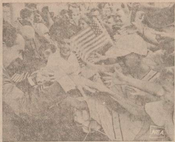
Tailandijoje prezidentą Nixoną apsupo vaikai, beisbolo mėgėjai. Jis visiems pakratė ranką.