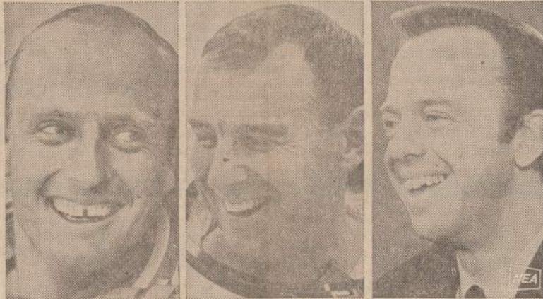
Charles Conrad Jr. Apollo 12 November, 1969 James A. Lovell Jr. Apollo 13 March, 1970 Alan B. Shepard Apollo 14 July, 1970