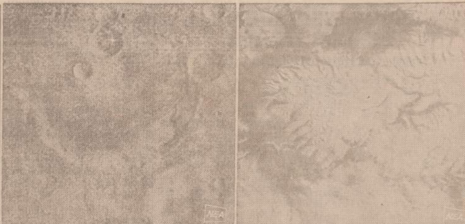
Iš didelių atstumų daromos fotografijos mažai mokslininkams pasako apie planetų sąlygas. Kairėje Marso vaizdas, o dešinėje matosi, kad ir Žemė iš tolo nelabai graži. Čia Mercury 9 astronauto Cooperio darva 1963 metais fotografija, kurioje matosi Himalajų kalnynas.