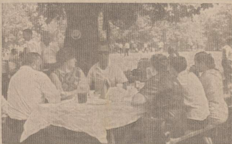
Sveikata ir gera nuotaika kyla žmonėms Alvdas išvykoje sveikai besimaitinant.

Mirusiems buvo daryta mediciniškas apžiūrėjimas; virš 40 metų vyrams buvo rasta labai mažai arteriosklerotoniai pakitimai aortoje ir širdies kraujagyslėse. Daug plonesnės buvo jų arterijų sienos, palyginus su tokiomis amerikiečių. Jų širdies raumuo buvo sveikas, tik šiek tiek turėjo surambėjimo apie kraujagysles. Tyrė gydytojai mano, kad tokia jų sveikata yra gero paveldėjimo vaisius.