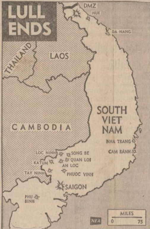
Kelias savaites pailsėję, komunistai ir vėl pradėjo pulti Pietų Vietnamo miestus ir karo centrus. Šiame žemėlapyje žvaigždėmis nurodyti komunistų puolami miestai.