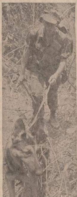
Amerikos kariai Vietname žvalgybos eina su šunimis. Ne viena amerikietiškas šunis yra apsaugojęs nuo mirties pavojaus. Labai dažnai šunis priešą iš tolo užuodžia. Paveiksle matome Amerikos žvalgą, tikrinantį Kambodijos pasienį.

— Pro Chicago penktadienį pravežtos iš Pirmo Pasaulinio Karo užsilikusios nuodingų dujų statinės. Vienas Kanados pramonininkas nupirko minėtas dujas, naudingas gamybos procesui. "Taikos" šalininkai rengiasi piketuoti traukinį, vežantį geležines dujų statines.