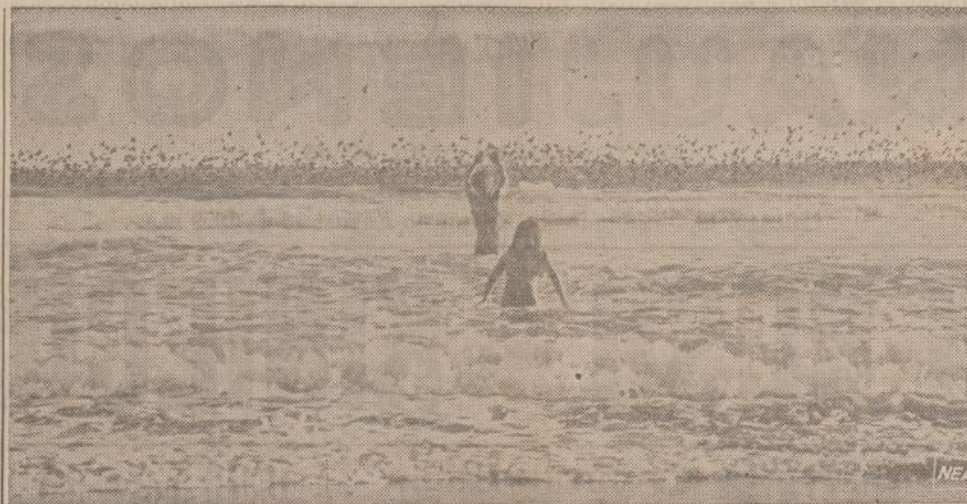
Kiekviena meta pakraščiu žuvėdros kelis kartus susirenka Kalifornijos pakraštį, Stinson Beach apylinkė. Čia suskrenda tūkstančiai, dešimtys tūkstančių žuvėdrų. Jos čia suskrenda kilku lėsti. Tūkstančiai kilku atplaukia į šiuos pakraščius, bet vėliau už puvalandžio prapuola. Tada prapuola ir žuvėdros.