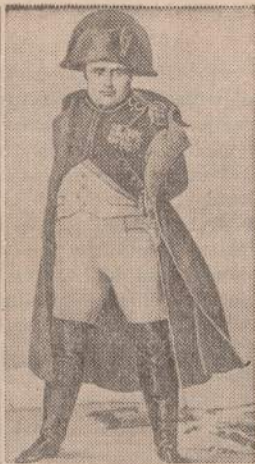
Rugpjūčio 15 dieną suėjo 200 metų nuo Napoleono gimimo dienos. Žemėlapyje sužymėtos Napoleono užkariautos sritys.

"1940 birželio 2 užsienių reikalų ministeris J. Urbšys savo telegrama pavadė min. Lozoraičiui eiti užsienyje pasilikusios Lietuvos diplomatinijos šefo pareigas, jei Lietuvą ištiktų katastrofa".