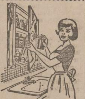
Savo naminių vaistų spintėje reikia nepaprastai švariai ir tvarkingai užlaikyti, kaip šiame vaizdelyje parodyta: išimti visas konkutes ir išmazgoti lentynas; patikrinti visus užrasus, kad neįvyktų klaidų, nes vaistų sumaišymas gali būti fatališkas, patikrinti, kokiu vaistų trūksta ir juos papildyti, kad būtum bet kokiam netvartumui pasirodęs.