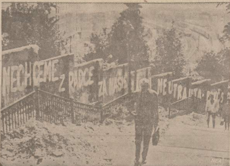
Sovietų karo įėgoms primetus Maskvai palankią valdžią, Pragos centre pasirodė šis didelis atšaukimas, kuris sako: "Mes nenorime, kad mus valdytų išdavikai. Norime būti neutralūs. Šalin okupantai!"

Lygiai 75 markes Petra gaus už pranešimą. "Aš dirbu ne