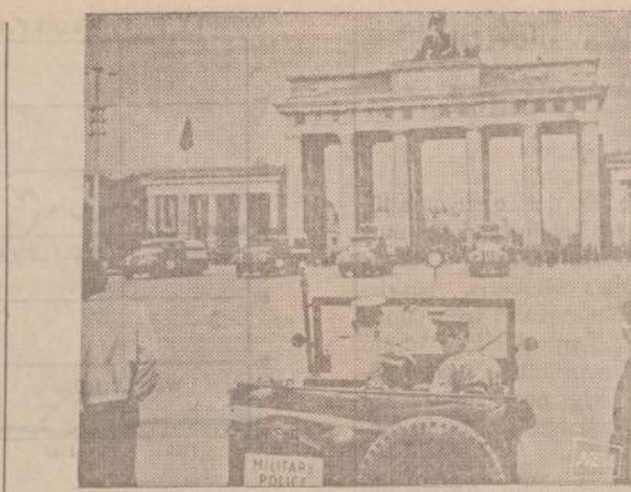
Britų karinė policija ir Rytų Vokietijos sunkvežimiai prie Berlyno Brandenburgo vartų 1961 metais.

Nemiegojau orlaivyje, bet kai pasiekiau Berlyną, tai anksti užmigau. Užtat pabudau dar prieš 4-tą valandą ryto. Bandžiau dar kurį laiką lovoje patūnoti, bet užmigti jau negalėjau. Atsikėliau ir apsi-tvarkiau... Jau pradėjo švisti. Pažiūrėsiu į gatvę, visur buvo ramu.