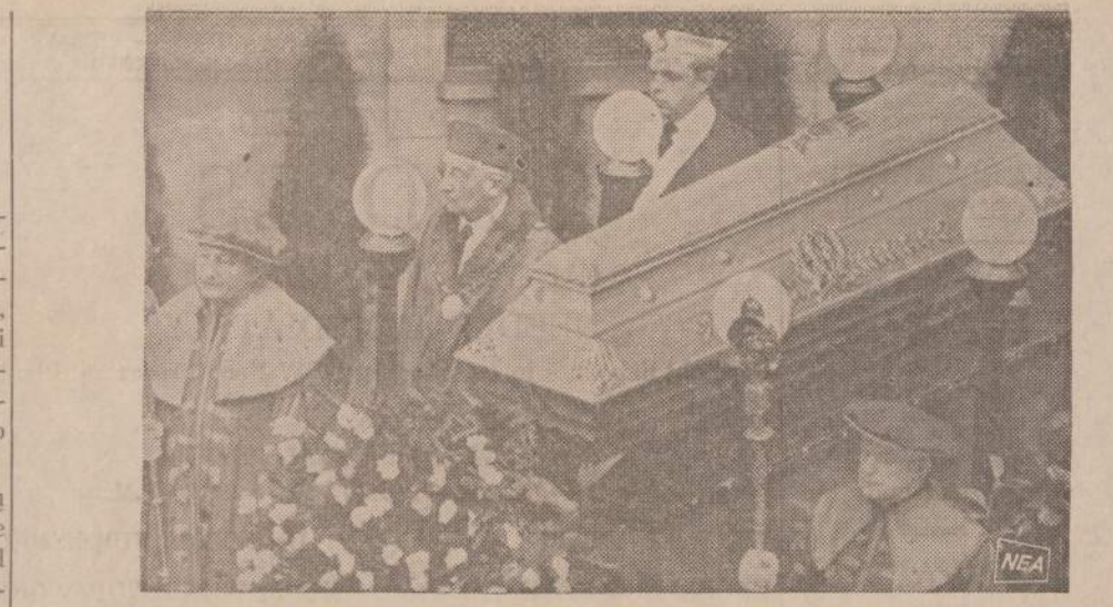
Praeitais metais Pragos Universiteto studentas Jan Palach, protestuodamas prieš sovietų karo jėgų okupaciją, apsiplė benzinu ir didžiojoje miesto aikštėje, prieš čekų universitetą, susidegino. Jo karstas buvo pastatytas didžiojoje universiteto saleje. Turėjo progos jį atsiveikinti visi profesoriai ir studentai. Paveiksle matome profesorius, lydinčius stud. Jan Palachą į kapus.

toseną, jos normas bei kri- terijus. — $1400.00.