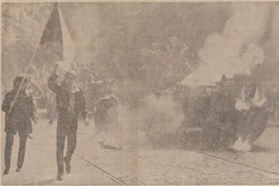
Praeity metų rugpjūčio 21 dieną, kai sovietų tankai įliaužė į Pragos centrą, čekų jaunimas protestavo ir padegė kelis sovietų tankus. Paveiksle matome čekų studentus, išskelčius čekų vėliavą ir rūkstantį sovietų tanką.

LISABONA, Portugalija. — Netikėtai sušvelnėjo cenzūra, kuri dar prieš kelias dienas griežtai prižiūrėjo, kad laikraščiai nespausdintų valdžiai nepalankių straipsnių.