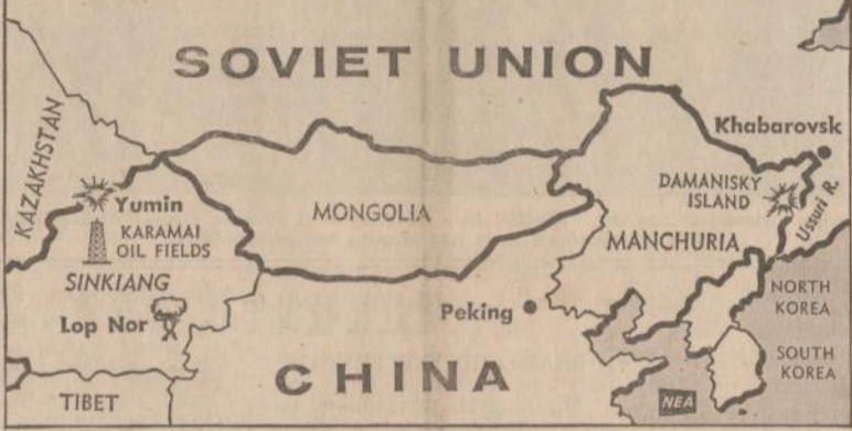
Azijos karštoji linija: Sovietų Rusijos ir raudonosios Kinijos pasienis, kuriame vis dažniau ir kruviniu prasideda susirėmimai.