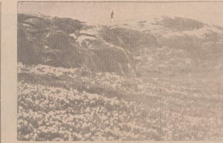
Tai yra Aliaska

Beabejo, caro Rusija anuomet didžiavosi esanti galinga pasaulinė imperija, kuri šiaurės Amerikos kontinento pakraščių sa-