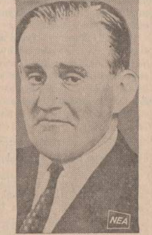
Kairėje matome James Chichester-Clark, šiaurės Irlandijos premjerą, o dešinėje yra Jack Lynch, Irlandijos premjeras. Prasidėjus neramumams šiaurės Irlandijoje, šiems vyrams teks susikirsti. Jiedu kitaip supranta airių gerbūvio reikalus.

2,000 žmonių teko paskubomis gubenti į ligonines, daryti operacijas ir teikti jiems pirmąją