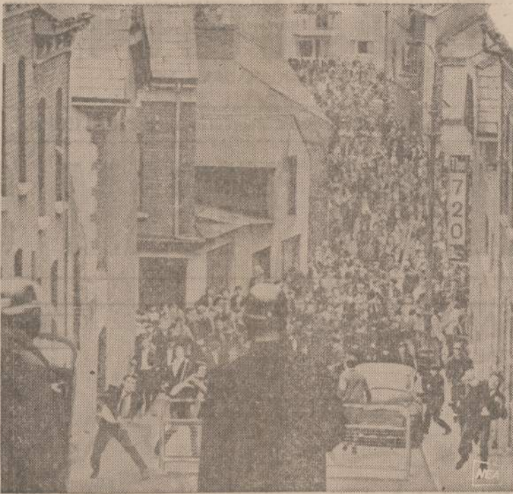
Is Airijos (Irlandijos) istorijos. Panašiai kaip šandien, prieš 50 metų šiaurės Airijoje policija gina užbarikuotą gatvę nuo akmenis metančios minios.

— Ačiū, mergyte, — sakau, — bet mes norime pirmą tėve-lius pamatyti. Ar namie?