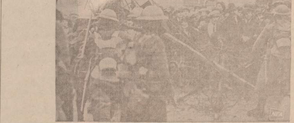
Britų kareiviai 1920 metais Dubline panašiai kaip šiandien užbarikadavę gatves užkerta respublikonų demonstracijai praeimą.

“Tikybą turi būti atskirta nuo mokyklos ir, mano nuomone, tikybą nuo to tikrai išloštų. Už tokį atskyrimą galima pavesiti dar vienas motyvas. Aš jau sakiau, kad mokyklos metodas turi būti darbo ir aktingo tyrimo metodas. Tai reiškia, kad mokyklos darbe mokinys turi dalyvauti aktingai visomis savo kūno ir sielos jėgomis, taip kad galėtų apsisireikšti jo savarankumas ir iniciatyva. Tikybos gi negalima sutalkinti su šiuo pedagogijos reikalavimu. Be to, tikybos mokslas veda prie nemalonių nesusiipratimų; veda prie to, kad dažnai labai gabūs vaikai griežtai nusistato prieš tikybą. Čia nekabėsime apie Adomą ir Jėvą, bet apie tokius dalykus, apie kuriuos tikybą kalba viena, o gamtos mokslas sako visai kita. Apie gyvybę atsiradimą ir evoliuciją žemės bažnyčia kalba viena, o mokslas kalba visai kita ir iš to išeina dešimtiesiū barnių ir nesusiipratimų. Tai iš to atžvilgiu, kad mokyklų privalo būti solidarumas, tikybą reikėtų perkelti į bažnyčią. Pavyzdžiui, dauguma anglų moksli tikybos bažnyčioje, o negalima pasakyti, kad jie būtų tokie dideli bedieviai.”