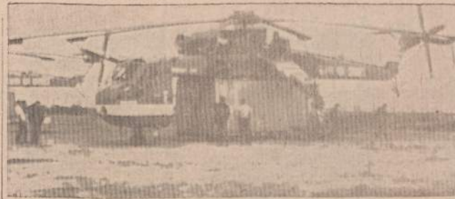
Vienas iš dviejų didžiulių Sikorskio tipo helikopterų - krenų, priklausantių Rowan Air Cranes, 90 pėdų ilgumo ir 72 pėdų diametro rotoru, gali pakelti ir 130 mylių per valandą greičiu pergabenti 20,000 svarų arba 10 tonų krovinio, pakelti į Aliaskos šiaurę.

Kai vieną dieną "juodasis auksas" į šiaurę nuo Brooks kalnų grandinės bus iš žemės gelmių iščiulptas iki paskutinio laišo, prasidės kita — anglies karštligė. Aliaskos kasyklų ir geologijos divizijos (skyriaus) raporte pranešama, kad šiaurėje nuo