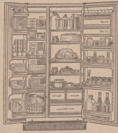
Hotpoint 21.3 cu. ft. Model CSF621K

GLASER'S FURNITURE AND APPLIANCE COMPANY