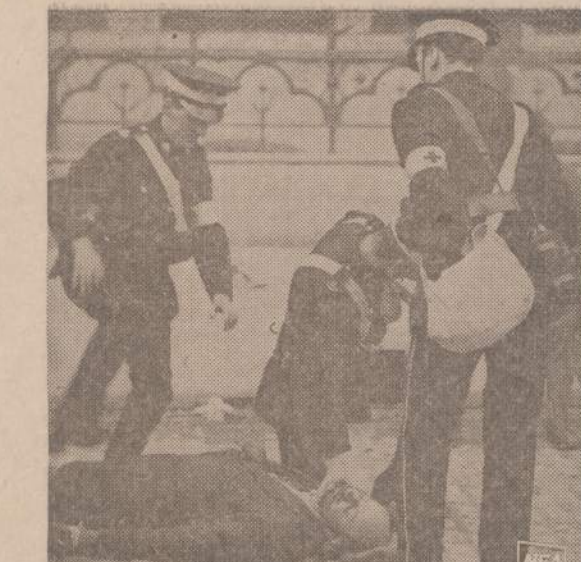
Britų Raud. Kryžiaus medikai suteikia pirmąją pagalbą Londonder-ry sužeistajam.

FOREST FIRES HURT OUR FOREST FRIENDS Our wildlife has no defense against the careless use of fire. So please follow Smokey's ABC's.