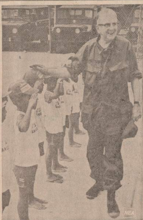
Prezidentas Nixonas paprašė, kad žinomas amerikietis dvasiškis dr. Norman Vincent Peale nuvažiuotų į Vietnamą patirti apie šalpos darbų organizavimą. Paveikslė dr. Peale sutinka vietnamičių vaikų "garbės sargyba" vienoje Da Nango vaikų ligoninėje.

KHARTOUMAS. — Buvęs Sudano prezidentas, komunistų nuverstas gegužės mėn., mirė namų arešte, kaip sakoma, nuo širdies priepuolio.