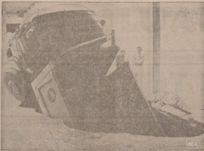
Atrodo, kad šis sunkvažimis išlenda iš akylės žemėje. Ispanijoje jis įkrito į gatvę iškastą duobę. Nelaimėje niekas nenulenkėto.