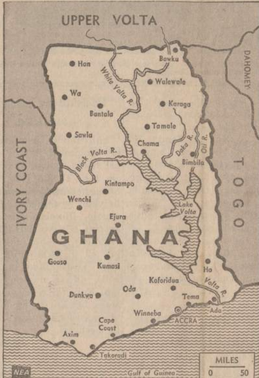
Rugpjūčio 29 d. Ganoje numatyti rinkimai, kurie turės sukurti naują valdžią, kuri pakeis karinį režimą. Karininkai valdo kraštą nuo 1966 metų, kada buvo nuverstas į komunistą pasinešęs diktatorius Kwame Nkrumah.

Tačiau, kaip minėta, valstybės departamentas nutaręs Saigono nespaušti ir į vyriausybės sudarymą nesikišti.