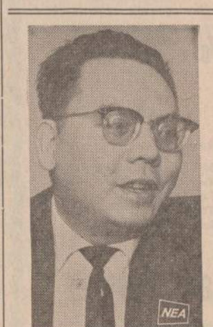
Naujas Pietų Vietnamo premjeras Tran Thien Khlem, 43 metų armijos generolas, kuris nuo vaikystės draugauja su prezidentu Thieu ir mėgsta su juo žvejoti.

Iki šiol buvo sužeista keliolika asmenų ir sudeginti du automobiliai. Mieste paskelbtas draudimas naktį pasirodyti gatvėse.