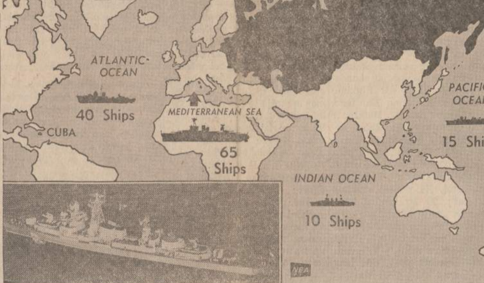
Sovietų Sąjunga po II-ojo pasaulinio karo pasistatė modernų karo laivyną, kuris pradėjo plaukioti visose pasaulio jūrose. Vienu metu apie 125 karo laivai patuliuoja vandenynus. Ju tarpa yra 25 povandeniniai laivai. Ypač daug laivų sovietai sutraukė į Viduržemio jūrą, kur stovi VI-sis JAV karo laivynas.