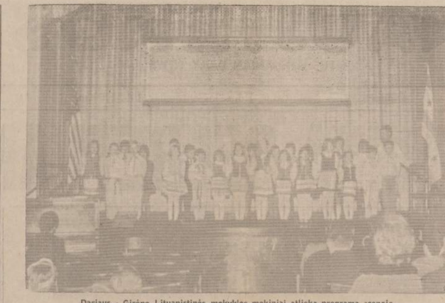
Darius - Girėno Lituaništinės mokyklos mokiniai atlieka programą scenoje.

Pabaltijo valstybių likimo reikalu yra labai svarbios ir begėdiškos trys slaptos sutartys: rugp. 23 d. sutartimi jos pasidalinamos tarpe Sovietų Sąjungos ir Nacinės Vokietijos sferiškai; Estija ir Latvija atitenka Sovietų Sąjungai, o Lietuva Vokietijai. Rugsėjo 28 d. sutartimi Lietuva ir Lenkija jau pasidalinamos tarpe Sovietų Sąjungos ir Vokietijos. Šita sutartis sutriuškina Maskvos ir jos propagandistų tvirtinimą, kad Lietuva pati Sovietų Sąjungon