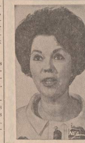
Žinoma filmų artistė Shirley Temple Black buvo prezidento Nixono paskirta JAV atstove Jungtinių Tautų generalinėje asamblėjoje.

WASHINGTONAS. — Vyriausybė pasiūlė kongresui šiek tiek pakeistą mokesčių reformos planą, kitokį negu praėjusių mėnesių buvo priimtas Atstovų Rūmų. Demokratai kongrese puola šį planą ir sako, kad visi palengvinimai duodami turtiniesiems mokesčių mokėtojams ir biznio korporacijoms.