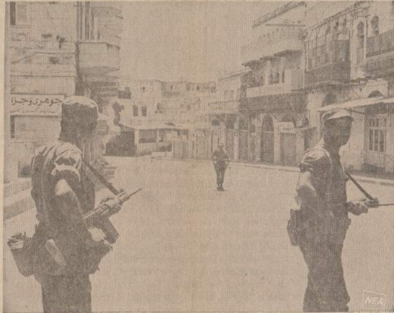
Gerai ginkluoti Izraelio kareiviai patruliuoja Nabluso miesto gatvėse. Nablus yra antras didžiausias miestas iš Jordano atimtoje arabų teritorijoje. Čia įvyko nemažai arabų partizanų veiksmų. Gyventojams uždrausta išeiti į gatves.