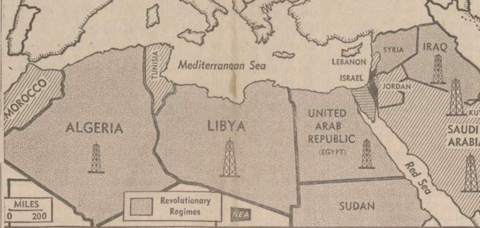
Libijoje valdžia iš karaliaus Idriso paveržė karininkai tuo pakeisdami arabų valstybių politinį balansą. Dabar revoliucinių karinių režimų yra valdomi: Alžyras, Libija, Egiptas, Sudanas, Irakas ir Sirija. Nuosaukių vyriausybės liko monarchijose: Saudi Arabijoje, Kuvaite, Maroke bei Tunisijoje ir Libane, kur valdo parlamentarinės demokracijos.