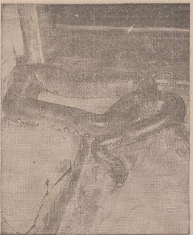
KAS NEMATĖ 30 PĖDŲ ILGUMO GYVATĖS? Ją galima pamatyti Linkolno parko zoologijos sodo reptilijų name ne- mokamai kasdien nuo 9 val. ryto iki 5 val. popiet. Tai gražiu vardu Anakonda smauglys, kurio tėvynė yra Pietinės Amerikos šiaurinė dalis. Žinoma, Chicago anakonda arba Eunectes Murinus yra trum- pesnė, gal 12, gal 18 pėdų — nepasakyta, bet yra užtekinai didelė, kadangi zoologijos sodas ją išrinko rugsėjo mėnesio žvėry "ka- ralaite".