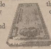
If they're lost, stolen, or destroyed, we replace 'em.

No, it isn't an immediate remedy for all our ills. But it helps.