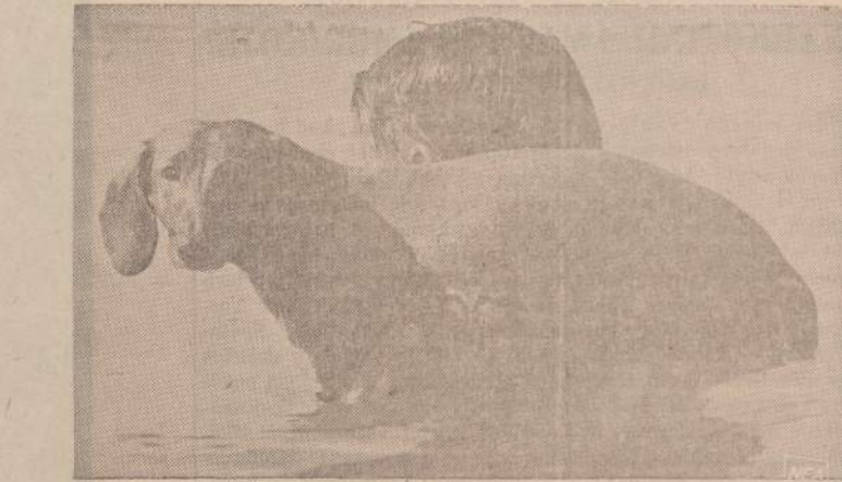
Šiltuose Bahamos jūros vandenyse pasimaudyti mėgsta ir šunelis "Tuffy". Pavargęs jis pailsi ant šeimininko peties.

Faktiškai toje rusifikacijos ūroje yra skandinami ne tik latviai, bet ir kitos tautos, kurias yra pavergusi Maskva.