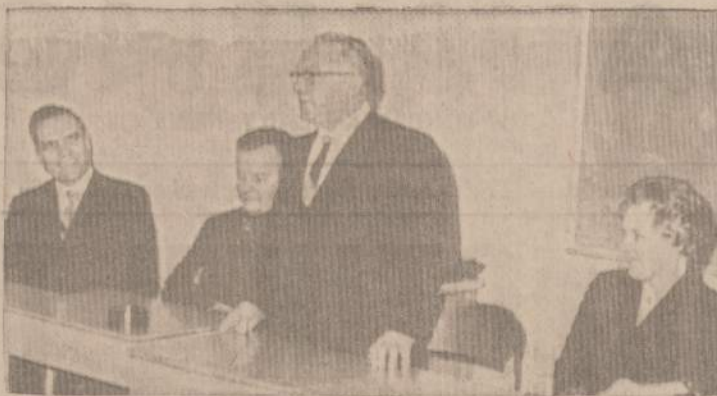
DABARTINĖ LIET. SKAUTŲ SAJUNGOS VADOVYBĖ,

a) LSS Tarybos, LSS Garbės Teismo ir LSS Kontrolės Komisijos nariai; b) Seserijos, Brolijos ir ASS Garbės Gynėjai; c) Seserijos, Brolijos ir ASS Vadai; d) Rajonų Vadai, Rajonų Dvasios VJ vadovai ir Rajonų Vadeivos; e) Seserijos ir Brolijos tuntininkai-ės bei vie-