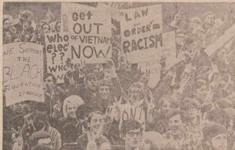
Naujiems mokslo metams prasidėjus, laukiama ir studentų neramumų, kurie pasireiškė Amerikos universitetuose pernai. Prasidėjo Berkeley universitete Kalifornijoje, įvairūs "sėdėjimo streikai", protestai prieš karą Vietnamo ir daugiau galių reikalavimai įnešti nemažai sąmyšio į Amerikos gyvenimą.

Negalėję pamatyti Amerikos pusėje vandens kritimo, nutarėme pavažiuoti į Kanadą. Kažkaip