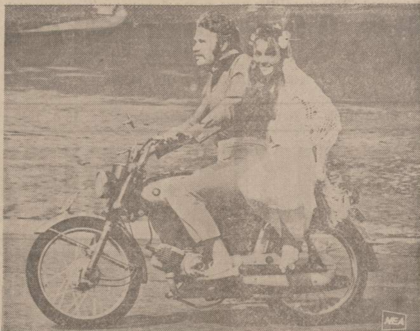
Tik ką susituokusi Australijos hipių pora važiuoja į povestuvinę kelionę. Motociklą jie turi, tačiau batų, matyt, šiltame klimate nereikia.

**) Kurpas — trumpinta poeto pavardė (Kurpita-Kurp) savo reikšme atitinka lietuvišką kurpę.