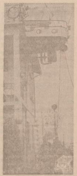
Vienas Italijos laivo kapitonas staidamas namus, ant stogo pasistatė laivo pavėdalo priestatą, kuriame jis ir atsargon išėjęs, mėgsta pabūti ir prisiminti tarnybos laikus.

— Turėtų būti lėktuve... Apieškojo visus stalčius, sėdynes ir po sėdynėmis, bet niekur rankvedžio nerado.