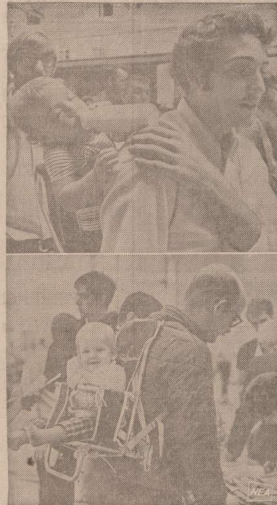
Daug Amerikos studentų yra vedę, turi šeimas. Viršų vienas toks studentas registruojasi Michigano universitete. Apačioje — tėvas su dukterim stovi eilėje Massachusetts.

Vaidintojų pavardės buvo išminėtos Naujienose po pirmojo šios komiškos operetės pastatymo rugpjūčio 9 d., tad vargu bereikėtų kartoti. Kai kas šį sąstatą pavadina "Vaikų teatro padalinium", gi vienu buvo rašyta, jog šis padalinys yra išaugęs iš vaikų teatro. Tenka pažymėti, jog per mažai laiko turėjo Alvdūdas išauginti iš vaikų teatro suaugusiųjų artistus. Logiška — padalinys gali būti sudarytas tik iš tokių pat, kaip ir pats vietetas. Antra vertus, tie, kurie vaikus moko vaidlinio meno, ruošia juos scenos darbai ir bendrai visi tam tikslui dirbantieji, neišskyrus nė grimoautojo, kuris žino kokį grimą ku-