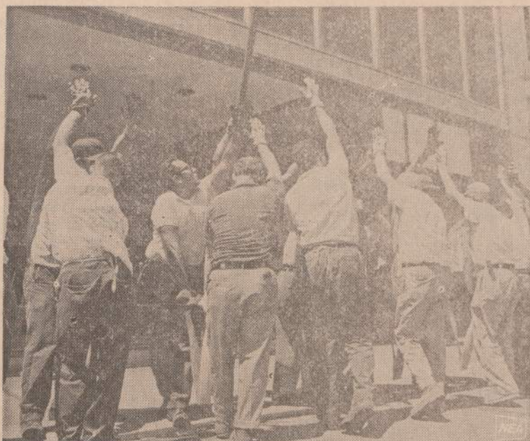
Iš pirmo žvilgsnio galėtų atrodyti, kad ši grupė vyrų žoka kokį nematytą šoki. Jie tačiau neša labai didelį gabalą stiklo, pagamintą Belgijoje. Stiklas įstatytas naujame pastate Čikagoje.

Jų deklaracijoje aiškinama, jog toji žemė kadaise priklausė