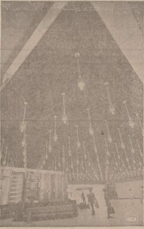
Dallas aerodromo pastate lubos pagamintos iš tamsaus kamščio, o aplinkui eina veidrodžio juosta. Vakarop, kai uždegamos lempos, at- rodo, kad lubos kabo ore.

Valgyklų daug teko pastebėti. Ir jos pas save visai viliojo. Vienuer piano skambino, kitur dūdas pūtė, dar kitur solisčių ar solistų balsai girdėjosi. Krautu- vėse įvairiausi suvenyrai pardu- vėjami. Ten tokių krautuvių daug. Vienoje didelėje krautu- vėvėje buvo parduvinėjama įvai- riausi jūrininkams reikmenys. Ten ant sienos sukabinėta ir