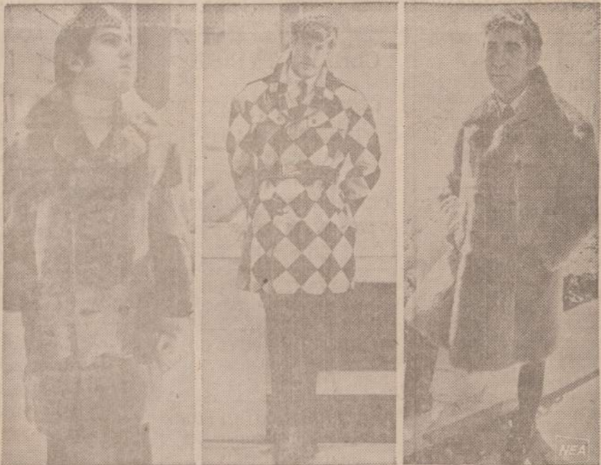
Kailių pirkliai nutarė, kad ir Amerikos vyrams tinka ir reikia nešioti brangių kailių apsiaustus. Jie, paprastai, nepigūs ir kol kas juos perka aktorai ir kiti daug uždirbantieji, mada sekantieji vyriškiai.