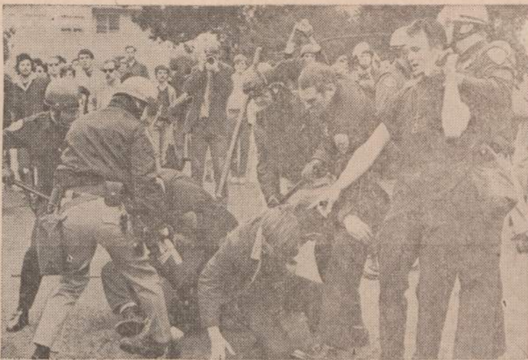
Studentų keliami neramumai ne kartą priverstę policiją įsikšti, kaip paveikslė matome, ne visai švelniomis priemonėmis.

Apžiūrėjome ir Nežinomam kariui pastatytą tose kapinėse paminklą. Keturkampiam paminkle įskalti šie žodžiai: "Here Rests in Honored Glory an American Soldier. Known but to God". Prieš paminklą aikštelėje patiestas juodos spalvos kilimėlis. Ant to kilimėlio stovėjo juodais rūbais apmęstas karys. Pastovėjęs vienam kilimėlio gale padarė sukinį ir kojų nelenkiančiu žingsniu bei tiesiu rankomis mosavimu, ateina į kilimėlio kitą galą. Vėl stipriai sumušdamas kulnėmis, daro sukinį. Į žingsniuojantį ar stovintį karį žiūrint atrodo, kad tai negyvas žmogus, bet manekenas. Karys buvo ginkluotas šautuvu su už-