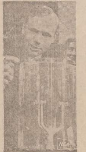
16 mėnuo parvežtas akmuo po stiklu laikomas Washingtono, D. C. Smithsonian Institute. Akmenį apžiūrino astronautas Neil Armstrong, pirmas žmogus ant Mėnulio.

Suvažiavimas LSS Vadovybės organus renka tiesioginiu, lygiu ir slaptu balsavimu. Koresp.