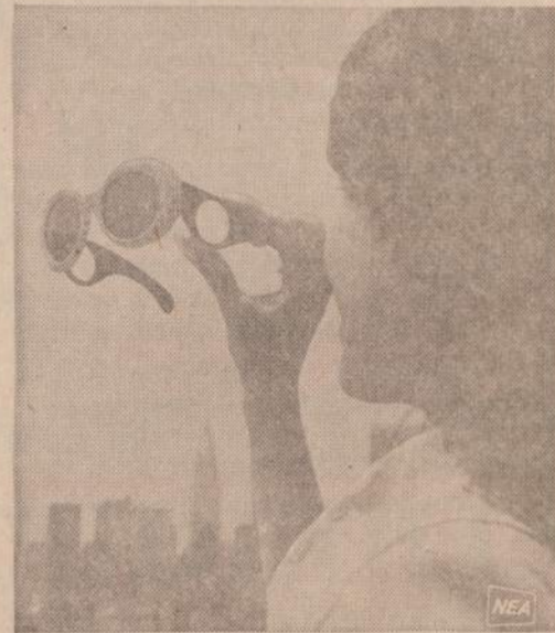
Tarp įvairiausių "nuo saulės" akinių yra ir tokie, kurių rėmuose įtaisyti du padingamieji stiklai. Per abu žiūrint, gaunasi teleskopinis, vaizdus priartinis rezultatas.

Jau atspaudinta ir galima gauti knygų rinkoje