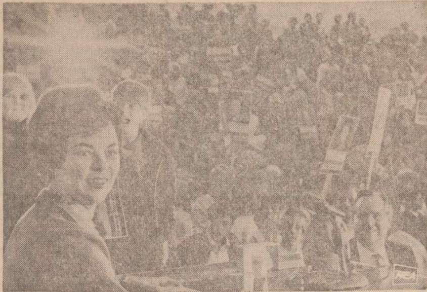
Buvusi žinoma filmų aktorė Shirley Temple-Black 1967 metais bandė laimėti vietą Kongreso, bet jai nepavyko. Pernai ji daug dirbo, kad būtų išrinktas prezidentas Nixonas. Šiemet jis jai atsidėjo, paskirdamas ją į JAV delegaciją Jungtinėse Tautose.