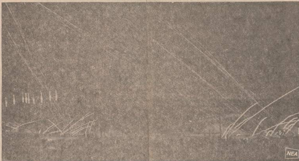
Vietname prie Da Nango marinių vykylos helikopteriai apšaudė stovyklos pakraščius. Šviečiančios kulkos naktį išraižo padangę įvairiais raštais.

pažinti ar nepripažinti Rytinės Vokietijos. Užtenka su ja turėti sutartis susisiekti, prekybos ir Berlyno klausimais. Panašiai jis kalba ir apie Neisės-Oderio linijos pripažinimą. Kadangi Vakarų Vokietija neturi su Lenkija sienų, jas turi tik Rytinė Vokietija, tai Bonai visai esą nereikalinga dėl tų sienų pasisakyti. Tai esanti siena tarp dviejų kitų valstybių. Bona juk neseniai lankėsi Maskvoje. Jo pasiūlymas yra gan pragmatiškas. Jis tvirtina, kad visai nereikia pri-