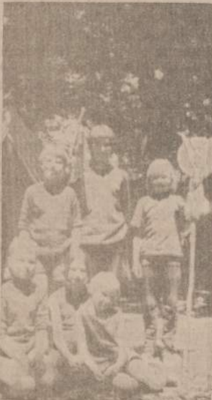
LAIMINGOJI "GILIŲ" SKILTIS,

Tur būt, ne kartą klausei savęs, lyg ta Šekspyro Julija: kodėl stovyklų vardai tokie senoviški, nežinomi, nieko bendro neturį su šių dienų skautais?