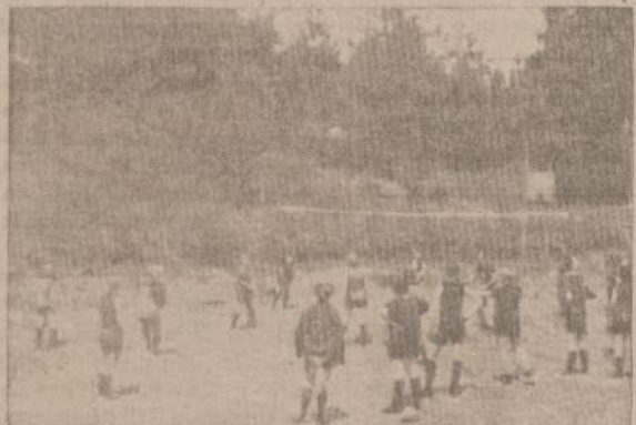
MERKINĖS MERGAITĖS PRIEŠ LITUANICOS BERNIUKUS Išdėla tinklinį Rako miška.

vių Amžiaus Merkinės skautė, kasdien stengdamasi būti geresnė, kovoja su Blogiu. Juk Blogis yra tas "svetimasis", kuris, įsiveržęs į širdies kampelį, greit užvaldo visą žmogų. Erdvių Amžiuje nebėra kryžiuočių, bet yra daug žymiai piktesnių ir gudresnių priešų, kurie užima ne tik kraštus, bet ir žmonių protus ir sielas. Tuos priešus nugalėt lietuvaite skautė gali, tik ugdydama savo protingumą ir atsakingumą. Protingas žmogus yra išvermingas savo darbuose ir pasižadėjimuose.