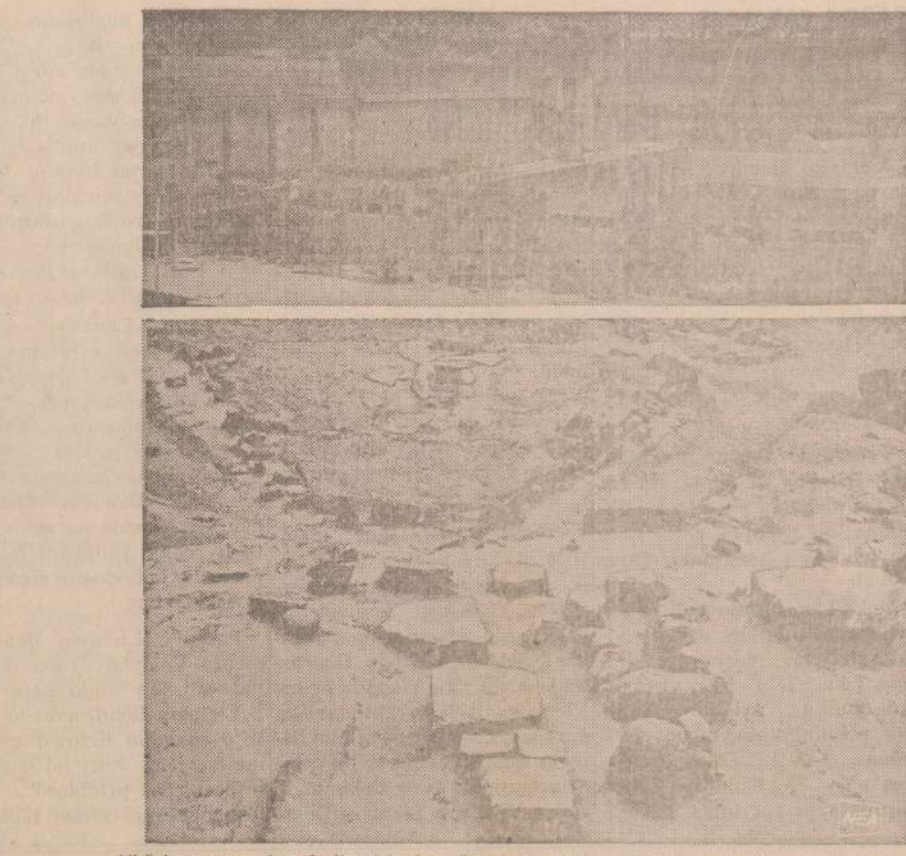
Viršuje matoma Jugoslavijos Džerdap užtvankos statyba. Užtvankai pradėjus veikti, vanduo užlies apaciūje matomą istorinį Lepenski Vir kaimelį, kuris laikomas seniausia žmonių gyvenviete pietinėje Europoje. Kaimo pastatai — akmonų luifai.