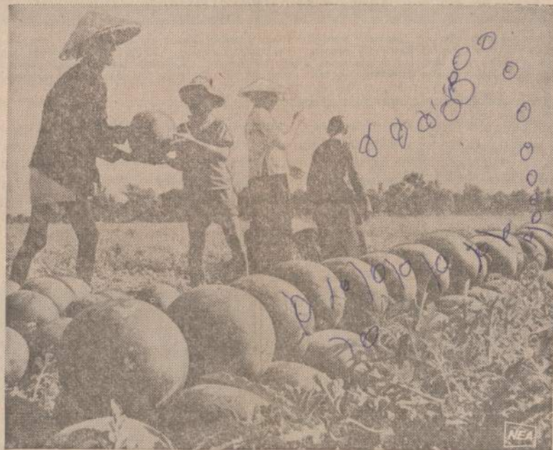
Amerika padeda P. Vietnamui netik gintis nuo komunistų, bet ir nuo bado. Speciali Amerikos arbūzų rūšis puikiai auga Vietnamo laukuose. Iš keliolikos 1964 metais atsiųstų daigų vietnamiečiai Mekongo deltoje jau apšodina šiais arbūzais 170 akrų.

JAKARTA. — Saugumo policija suėmė 35 komunistus, kurie įtariami vykdę ekonominį sabotажą Rytų Javoje. Sabotažininkai atakavę cukraus plantacijas, dirbtuves, miškus, susisiekimą, geležinkelius ir vieškelius.