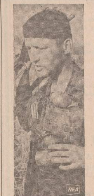
Amerikos kareivis Vietname, apsikarsęs granatomis, ieško komunistų netoli Kambodijos sienos.

♦ Demokratų partijos reformų komitetas ragina visas valstijas leisti balsuoti nuo 18 metų amžiaus.