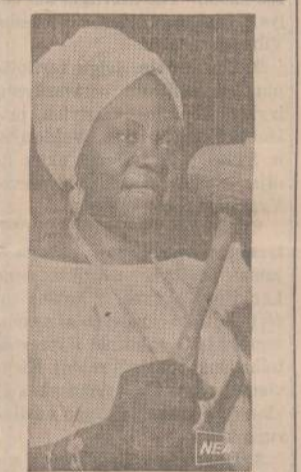
Liberijos diplomatė Angie Brooks šiais metais buvo išrinkta Jungtinių Tautų gen. Asamblėjos pirmininke.