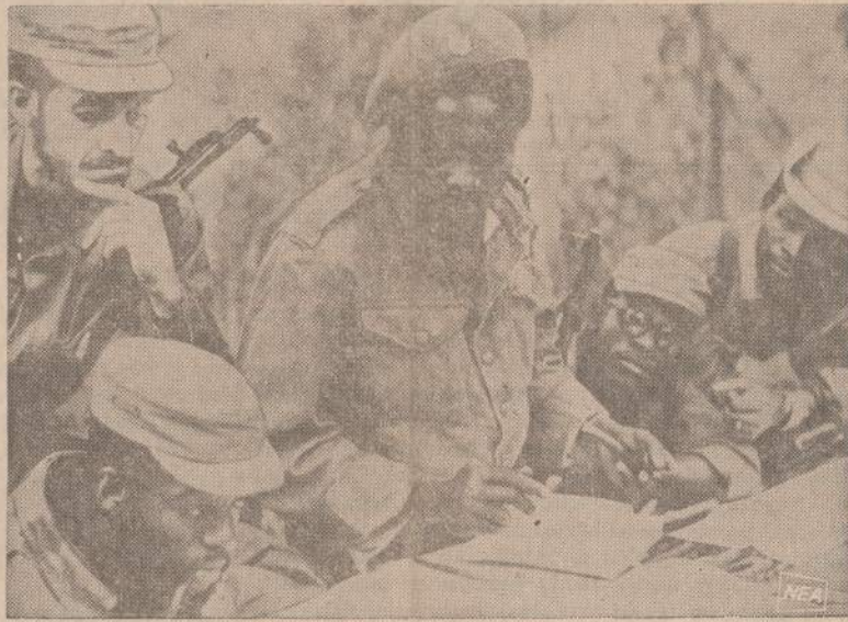
Sovietų žinių agentūra paskelbė šią Angolos išlaisvinimo organizacijos vadų nuotrauką. Angoloje, kurią valdo portugalai, vyksta partizaninis karas. Ginklus ir patarėjus parūpina komunistinės valstybės.