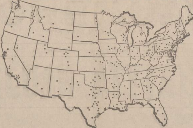
Vienas svarbiausių studentų riaušių ir neramumų taikynys pernai buvo ROTC daliniai (Reserve Officer Training Corps). Revoliucionieriai studentai reikalauja tuos dalinius iš universitetų pašalinti. Žemėlapyje parodoma, kur tie daliniai yra.