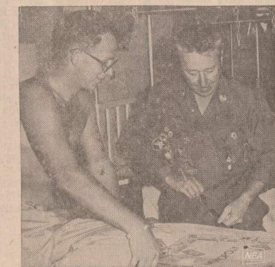
Aktorius George Gobel lankėsi Vietname, kur jis pradžiugino sužeistuosius marinius savo špousais ir anekdotais.

kės, tuo tarpu kai aukšti pelnai, dividendai ir interesai (procentai) yra tikrieji kaltininkai, kad krašte pragyvenimo išlaidos nepaprastai kyla, — tvirtino jis.