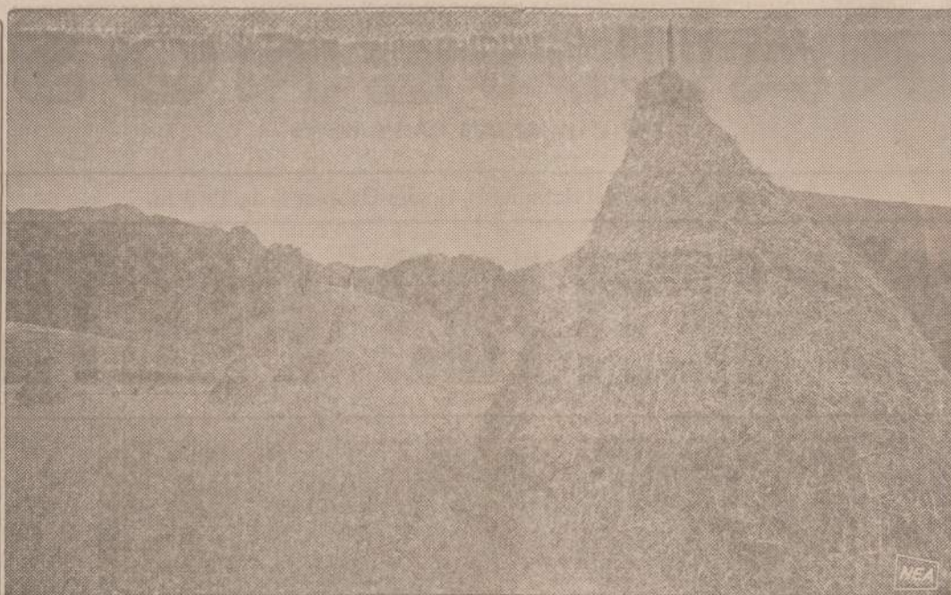
Vadinamieji Hillbillies Amerikos pietinėse valstijose yra toli atsilikę nuo modernaus Amerikos žemės ūkio metodo. Čia sukrautas šienas laukia arklio tempiamo vežimo. Artimiausias miestelis yra už 20 mylių. Ten ūkininkas nuvažiuoja ka tą per mėnesį.