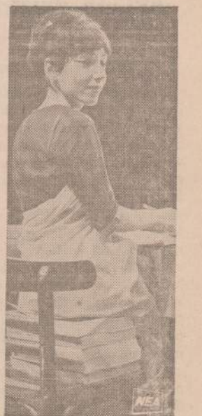
Viena britų politiko sekretorė, neturinti nei penkių pėdų, išsprendė sėdėjimo problemą su keliomis telefono knygomis, kurias padeda jai pasiekti stela.

Paskiečius komunistų leidinius Amerikoje: Daily World,