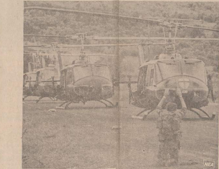
Kareivis atsiklaupęs nesimeldžia prieš modernius karo dievus. Jis nurodo helikopterų pilotams kur nusileisti į tvarkingą eilę Vietnamo aerodrome.

Maskvoje skelbiama, kad premjeras Kosyginas savo susitikime su Chou En Lai siūlė pradėti pasitarimus dėl abiejų valstybių sienos nesuspriatimų. Be to, Kosyginas siūlė abiem atitraukti pasienio kariuomenę, siūlęs susitarti nešaudyti į kitą pusę, prašęs leisti sovietų lėktuvams skristi į Hanojų per Kiniją ir siūlęs sugrąžinti į abi sostines ambasadorius. Kinija į tuos jo pasiūlymus dar neatsakiusi.