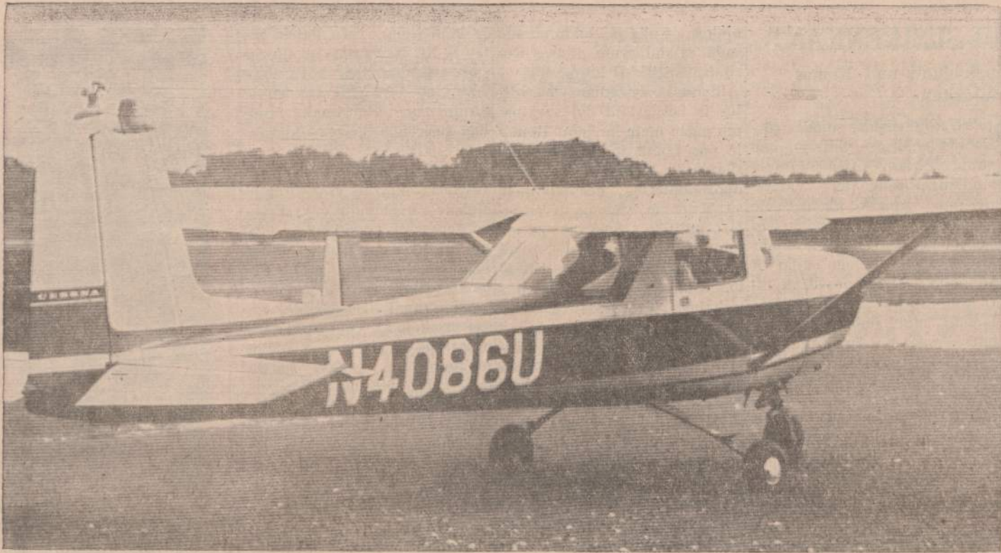
Amerikos Lietuvių Aero Klubo lėktuvas Cessna 150 Griffith, Indianos aerodrome (1969 m. rugsėjo mėn. nuotrauka).