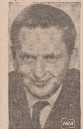
Naujas Švedijos socialdemokratų partijos vadas ir vyriausybės premjeras Olof Palme, 42 metų amžiaus.

Naujas Brazilijos prezidentas Emilio Garrastazu Medice pareiškė kovosias prieš kraštutiniųjų smurtą ir prieš dvarininkų ir biznierių konservatizmą. Jis sieks sugrąžinti Brazilijai demokratinę sistemą. Las Vegas negry riaušės truputį nurimo, kai du buvo nušauti ir 29 suimti.