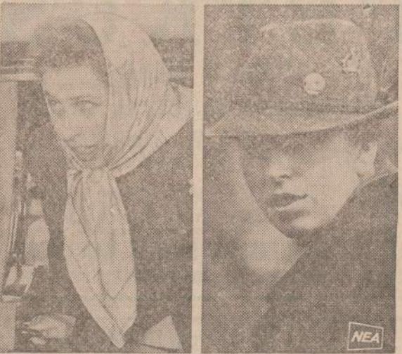
Britanijos princesė Anne mėgsta įvairių pavidalų skrybėles. Britų spauda mėgsta dėti jos fotografijas, iš kurių matosi, kad ji gerokai panaši į savo motiną, karalienę Elžbietą.

RENTING IN GENERAL Nuomos ISNUOMOJAMA PIGIAI veikianti ta- varna ir butas su 4 kamb., Brighton Parke. Skambinti savininkui tel. BI 7-4077