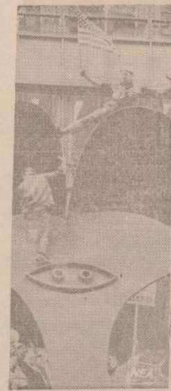
Čikagos miesto centre stovinti Picasso skulptūra labai mėgiama įvairių demonstracijų dalyvių. Visi bando ant jos užlipti. Paskutiniai buvo statybos darbininkai, kurie yra įpratę laipti dideliuose aukštuose, stant dangoraižius.