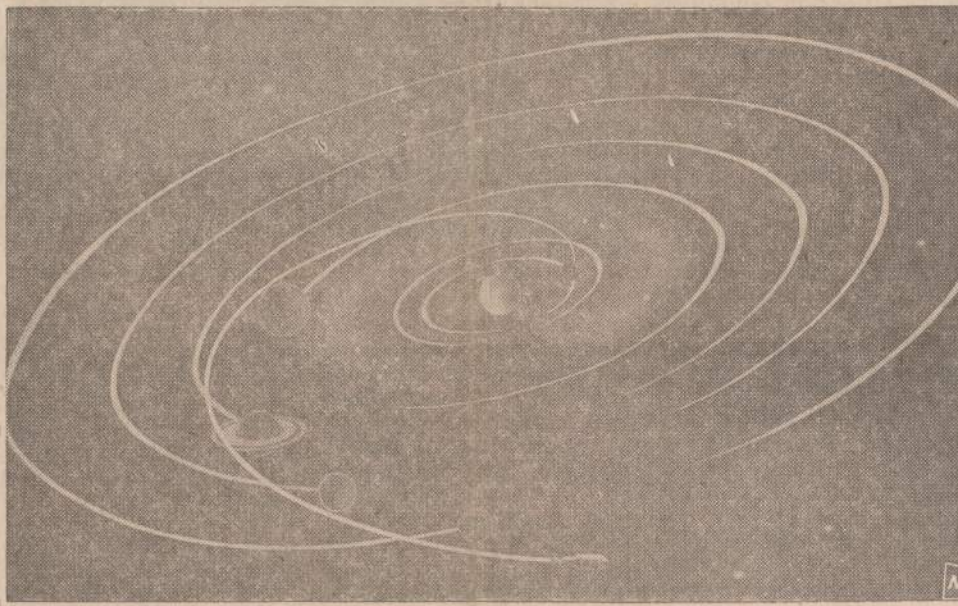
Kartą per 175 metus keturios planetos: Jupiteris, Saturnas, Uranas ir Neptunas taip išsiričiuoja, kad jas visas galima apimti su vienu erdvėlaiviu. Toks atvejis bus 1976 metais ir Amerikos mokslininkai jau svarsto, kaip išnaudoti susidarčiusią progą. Kelionė pro keturias planetas užtruktų 9 metus, todėl erdvėlaivis būtų be igulos.

LONDONAS. — Iš vieno priemiesčio šiuokšlių išvežėjų streikas išsiplėtė po visą Londoną. Streikuoja ir kapinių duobių karsėjai, gatvių šlavėjai, parkų prižiūrėtojai. HOUSTONAS. — Air East Airlines nusamdė keleivinio lėktuvo pilotą 30 metų moterį, Jo Claire Welsh. Ji skraidys su 18 keleivių lėktuvu.