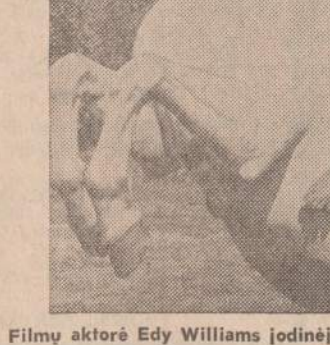
Filmų aktorė Edy Williams įdėtinėja ant savo balto žirgo "Winkey".

HOT SPRINGS, ARK., 132 CHAPEL ST. Skubiai parduodamas geras 15 kam- barių namas (12 išnuomojami, 3 sa- vinkinkui gyventi).