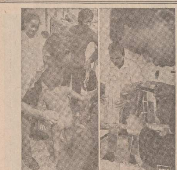
Vietname amerikiečiai ne vien kariauja, bet padeda vietnamiečiams įvairiose srityse. Kairėje Raudonojo Kryžiaus savanoris mado sergantį vaiką, dešinėje karo pabėgėlis mokosi staliaus amato.

MONTEVIDEO. — Policija kovos su Urugvajaus teroristais, kurie apilėšė tris bankus ir buvo okupavę policijos būstinę, tris banditus nušovė ir 12 paėmė nelaisvėn.