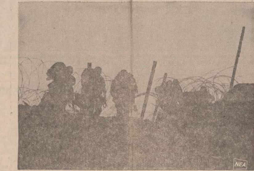
Vaidai iš karo lauko mažai keičiasi. Šioje scenoje, kuri galėtų būti iš Pirmojo Pasaulinio karo laikų, amerikiečiai parašiotininkai aploaidžia Vietnamo Ashau sienį.

Brazilijos prezidento pareigas šiuo metu eina armijos, karo laivyno ir karo aviacijos ministrai. Be jų trijų, aukščiausiąją krašto valdžią sudaro visų trijų ginklo rūšių štabų viršininkai ir generalinio štabo viršininkas gen. Orlando Geisel. Parinktas generolas Medice yra 63 metų amžiaus.