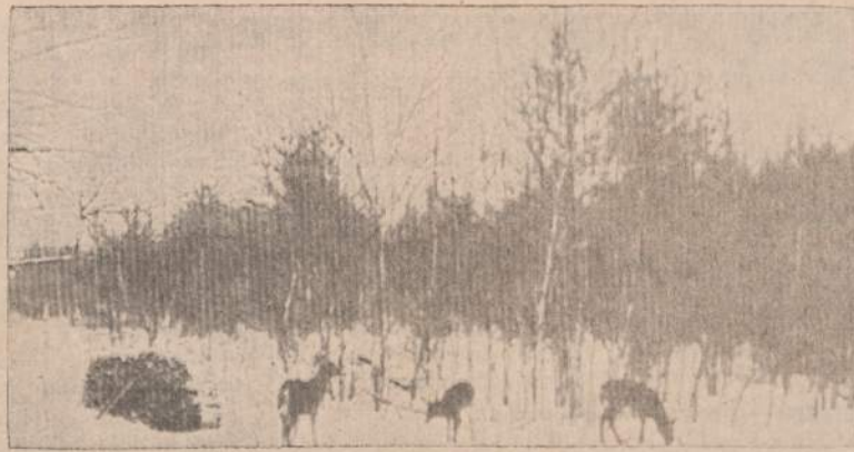
Blaney Parke žiemos metu.