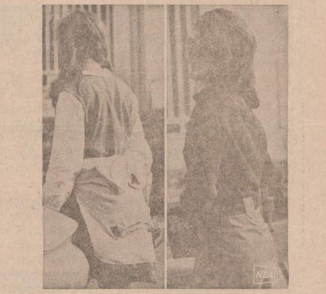
Buvusi Kennedienė, dabartinė Jacqueline Onassis, sako, išleisdama rūbams daug pinigų. Kartais fotografams pavyksta iš „pagauti ir nelabai puošniai apsidėdusios. Kairėje jos dukta Caroline Kennedy, dešinėje — pati Onassienė New Yorke prie savo namų.