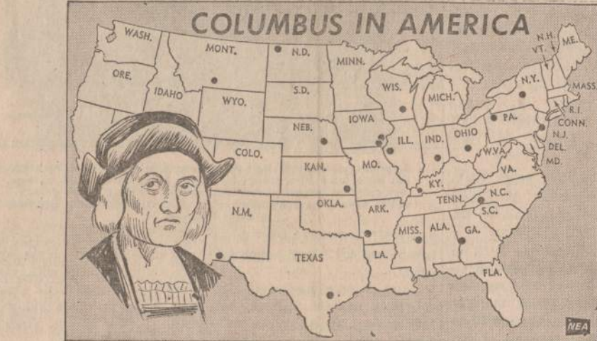
Kristupas Kolumbas, laikomas Amerikos atradėju. Jo vardu Amerikoje yra pavadinta 20 miestų ir miestelių. Iowa turi du: Columbus City ir Columbus Junction. Žemėlapyje taškais pažymėti visi Columbus vietovardžiai.

lankyti ir Ottawoje — Kanados sostinėje. Pakvietimas buvo prancūzų atmetas. Tas gerokai supykino Kanados valdžią. Net patys prancūzų laikraščiai stebisi tokiu nediplomatišku valdžios atstovų pasielgimu. "Le Monde" rašo, jog gaunasi įspūdis, kad Prancūzijos vyriausybė yra ypatingai malonu įžeidinėti Kanados vyriausybę.