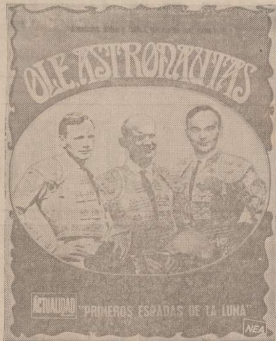
Amerikos astronautai: Neil Armstrong, Edwin Aldrin ir Mike Collins buvo labai šilaiti sutikti Ispanijoje, kur plakatai, kaip matome, juos rodė apsirėngusius puošniais mašadorių rūbais. Madrida astronautai dovanų gavo panašius rūbus iš dviejų garsiausių Ispanijos bulių kovotojų.

Tatai, ano meto Vilniuje įvykusio konferencija pripažino, kad Lietuvoje jau veikia valstybinis aparatas, o Rusijos raudonoji armija pasiryžo sukliudyti Lie-