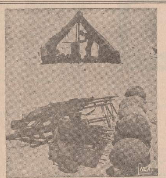
Rugsėjo mėnesį žydai sutiko savo naujus, jau 5730-sius metus. Paveiksle matoma Izraelio kariuomenės grupė Sinajaus dykumoje, kur menka palapinė duoda labai mielą pavėšį nuo karštų saulės spindulių.

NEW YORKAS. — Aštrūs moteriškos dantys padėjo policijai sugauti plėšiką. Harriet Neham buvo užpulata plėšiko, kuris uždėjo ranką jai ant burnos, kad ji nešauktų. Ji smarkiai sukando jam į mažąjį pirštą, kurio galas liko jos burnoje. Policija, gavusi piršto galą, patikrino atspaudą ir rado srašiuose seniai paieškoma plėšika. Dabar jis suimtas.