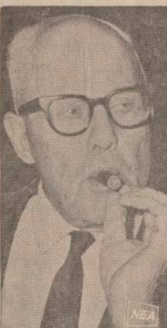
Darbo unijų federacijos prezidentas George Meany pareiškė senato komitetui, jog darbininkų federacija nepretaria prezidento Nixono parinktam kandidatui į Aukščiausią Teismą Clement Haynsworth.

BONA. — Vokietijos statistikos biuras paskelbė, kad vidutinė keturių asmenų šeima Vokietijoje išleidžia maistui 32% savo pajamų, butui — 15% ir rūbams — 11%.