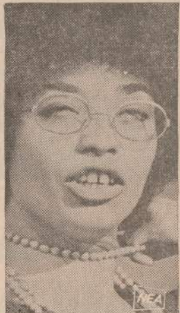
Kalifornijoje eina ginčai apie šią moterį — Angela Davis. Ji neslepia, kad ji komunistė. Ji tačiau yra Los Angeles universiteto dėstytoja. Patrikietinių Taryba bando ją pašalinti iš pareigų. Dėl to kilo triukšmas. Komunistai ir jų draugai rėkia, kad Amerikos konstitucija laužoma, kalbos laisvė paniekinama. Kasin kiek ilgai koks "fašistas" padėstytų Maskvos universitete?

MASKVA. — Sovietai neprišiminė penkerių metų sukakties nuo Chruščiovo pašalinimo. Korespondentai sako, kad kolektyvinis valdymas veikia geriau, negu tikėtasi. Brežnevo-Kosyginovo valdžia esanti tvirtai jų rankose. Spėjama, kad ateityje Brežneva gali pakeisti Andrei Kirilenko, o Kosyginą — Dimitri Polijanski.