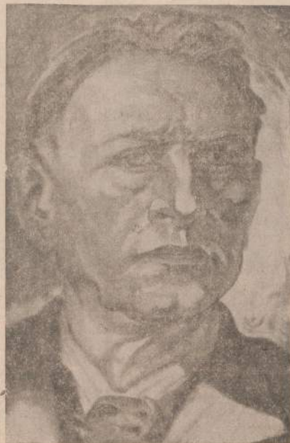
PROF. BALYS SRUOGA

Šiandien, spalio 16 dieną, sueina 22 metai