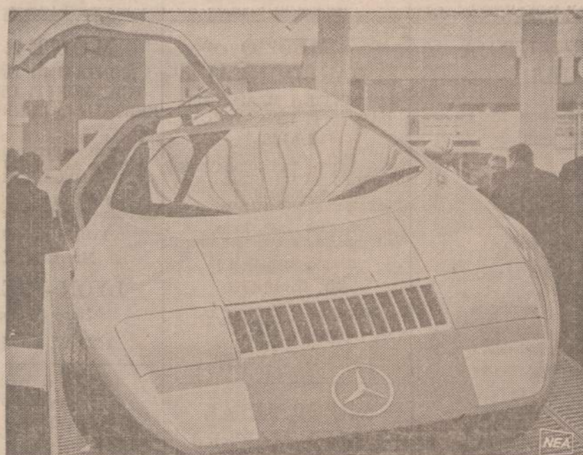
Tarptautinėje Paryžiaus Automobilių parodoje vokiečių Mercedes-Benz įmonė išstatė savo naują modelį C-111, kurio durys atsidera iš apačios į viršų.

kurie atsidūrė net prie Verduo, kur buvo sulaukyti vokiečiai. Miestas vis augo ir steigėsi naujos pramonės įmonės. Gyvenamumas namus žmonės statėsi toliau nuo miesto centro. Miestas išaugo, atsidarė nauji bizniai ir prekybos centrai. Didžiosios krautuvės turi ir automobiliams pastatyti aikštes. Didžiausi bizniai yra rytų pusėje, o mažesni ir įvairios įstaigos — šiaurėje. Ten ir gyventojai pasistatė gražių mūrinių namų.