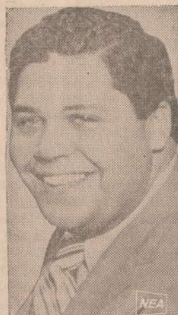
Dar vienas neigras buvo išrinktas į aukštą vietą. Atlantos miesto vicemėras Maynard Jackson apie trečdajį savo balsų gavo iš baltųjų.

◆ Izraelio aviacija vakar du kartą puolė Egiptą ir kartą — Jordaną.