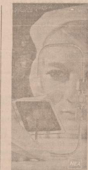
Elektroniniai prietaisai turi daug mažų dalių, kurios turi būti labai švarios. Paveikslė matoma Honeywell techninė oru išpučia dulkes iš vienos dalies, kur mažą dulkelę galėtų sukelti gedimus.

Šiam išradimui daktarai deda daug vilčių kovoje su leukemija, tikėdami, kad pridavimas