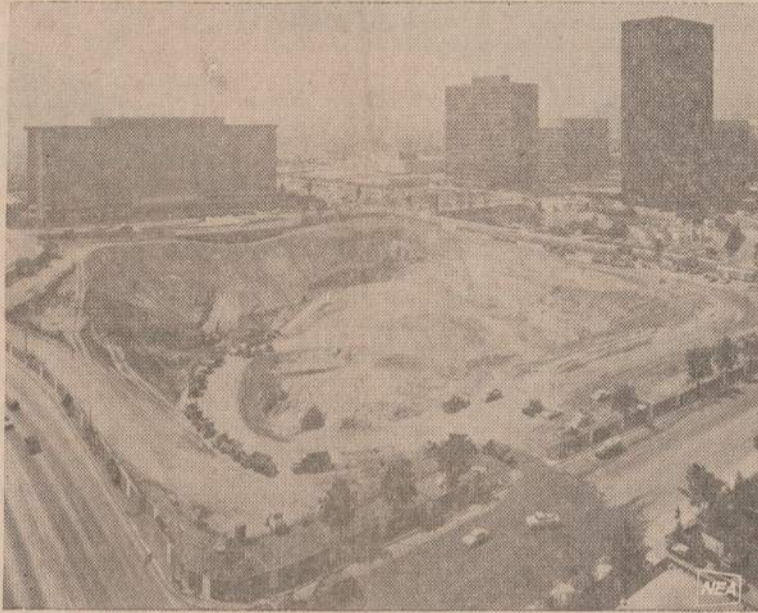
Kalifornijoje, Century City statomas didžiausias pasaulyje požeminis garažas, kur galės tilpti 6,000 automobilių. Kasama gili duobė, kurios žemės galėtų pripildyti pusantro Empire State pastato New York'e.

Šiais metais American Motors, kurių žinomiausieji gaminiai buvo Rambler modeliai, išleido naują modelį "Hornet".