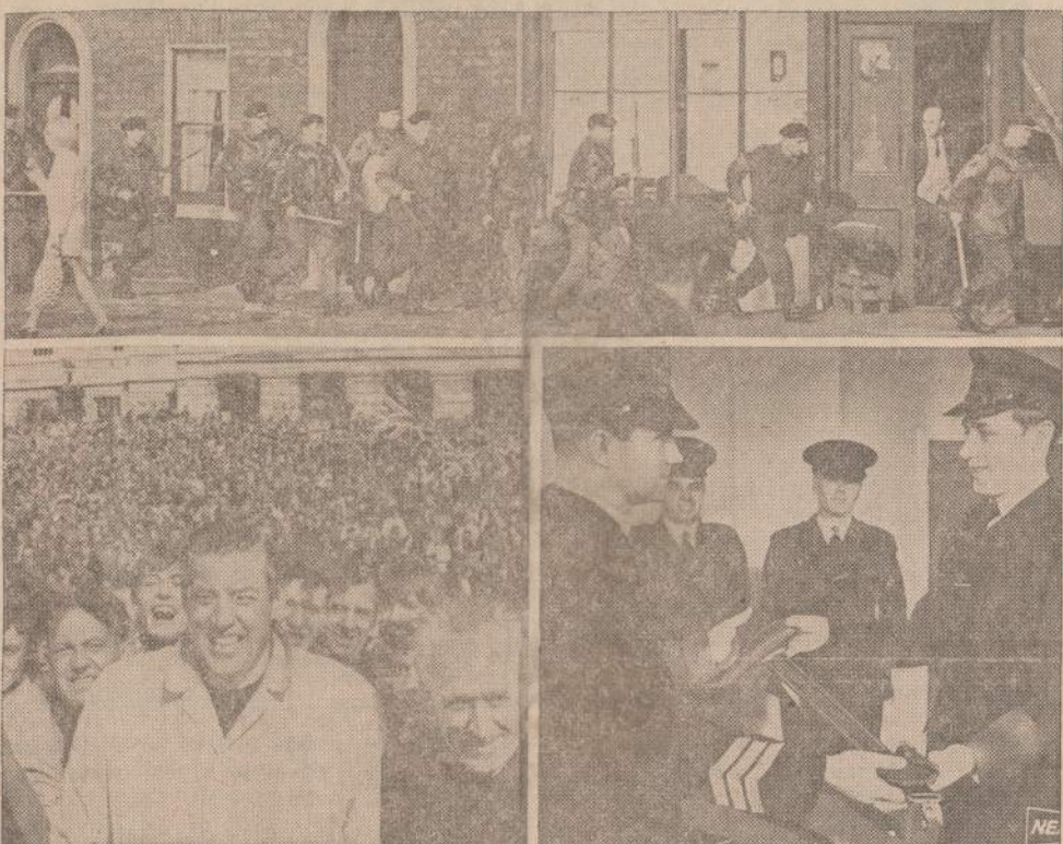
Šiaurės Airijoje konfliktas tarp protestantų ir katalikų nesibaigia. Viršuje matome britų kareivius patuliuojančius katalikų rajoną. Apačioje, kairėje minia protestantų su savo fanatiku vadu, kunigu Ian Paisley, dešinėje — Belfasto policininkas atiduoda britų daliniui savo revolverį.

Pirmamečiai studentai kartais bijo pajuokos ir pravardžiavimų iš senesniųjų studentų, ROTC priešų. Jie nemėgsta pasirodyti universitete su uniforma. Kiti tačiau pareiškė turį gilių principinių priekaištų karo mokslui. Vienas Berkeley universiteto studentas medikas pasakė korespondentui, kad visi sa karinė struktūra jį tiesiog susargdinanti. Jis mokosi, kaip