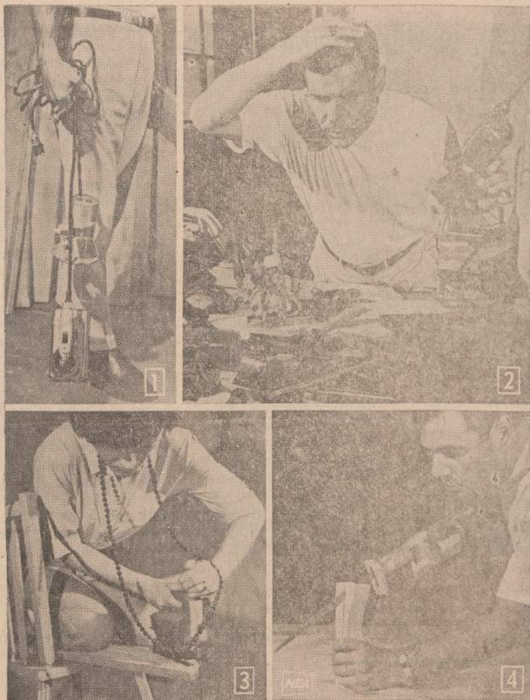
Vasarai pasibaigus milijonai amerikiečių pradės dirbti savo namuose. Apskaičiuota, kad apie 70 milijonų amerikiečių laiko save staliais, dažytojais ir kitokiais "handymenais". Čia parodomos klaidos, kurias mėgėjai daro. Viršuj rodoma, kaip nereikia nešioti elektrinių įrankių — už viešos šalia — netvarkingas stalius neranda, ko jam reikia. Apačioje ilgi karoliai trukdo dirbti, o dešinėje — stalius naudoja per ilgą piūklą ir nesaugiai laiko piūvaną medžio dalį.

Buto savininkai buvo labai labai malonūs žydai. Tą lietingą mobilizacijos dieną visa jų šeima buvo namuose. Sakiau, jog išeinu žinių apie mobilizaciją pagaudyti ir palikau Katinausko baro telefono numerį, jei kas ma-