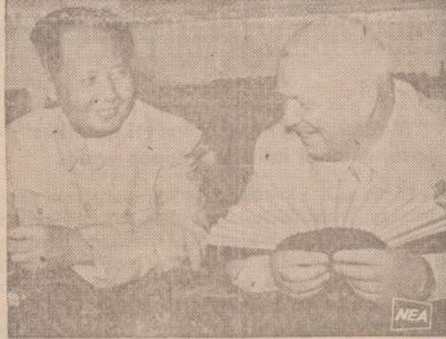
Kinijos Mao Tse Tungas labai gerbė Staliną, kurio pėdomis jis bando eiti Kinijoje. Kada valdiži Sovietų Sąjungoje pasėmė Chruščiovas, santykiai tarp abiejų komunistinių galybių pradėjo blogėti. Mao Tse Tungas Chruščiovą vadina "revizionistu".

Perplaukus Atlantą ir pasiekus apsiostojimo vietą, mus tuoj pasveikino Amerikos lietuviški laikraščiai. Tai senųjų ateivų įsteigti spaudos institucijų švyturiai. Jie juos guodė, jun-