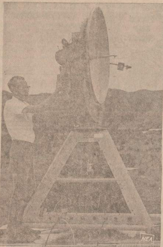
Šiais laikais oro pranešimai yra pagrįsti įvairių tyrimų rezultatais, komplikuoju aparatų matavimais. Paveikslė matoma antena stovi Naujoje Meksikoje ant aukšto kalno, Langmuir Laboratorijoje. Mokslininkas matuoja griaustinio stiprumą.